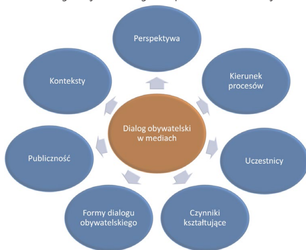
Rysunek 2. Kategorie analizy medialnych reprezentacji dialogu obywatelskiego w opiniach dziennikarzy

W analizie wypowiedzi dziennikarzy wyodrębniono siedem głównych wątków, które pojawiły się w tych narracjach i dotyczyły opinii na temat medialnego obrazu dialogu obywatelskiego (rys. 2.). Należą do nich: główne konteksty prezentowania rzeczowej tematyki, dominująca perspektywa narracji, najczęściej występujący kierunek opisywanych procesów, częstotliwość i charakter występowania poszczególnych aktorów dialogu obywatelskiego, czynniki kształtujące medialny obraz dialogu obywatelskiego, występowanie zróżnicowanych form dialogu obywatelskiego oraz rola odbiorców.