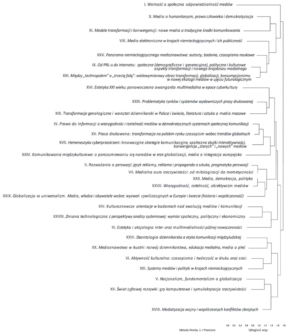
Schemat 2. Główne wątki tematyczne recenzji i sprawozdań naukowych autorstwa ISF na lamach Zeszytów Prasoznawczych w latach 1985–2013