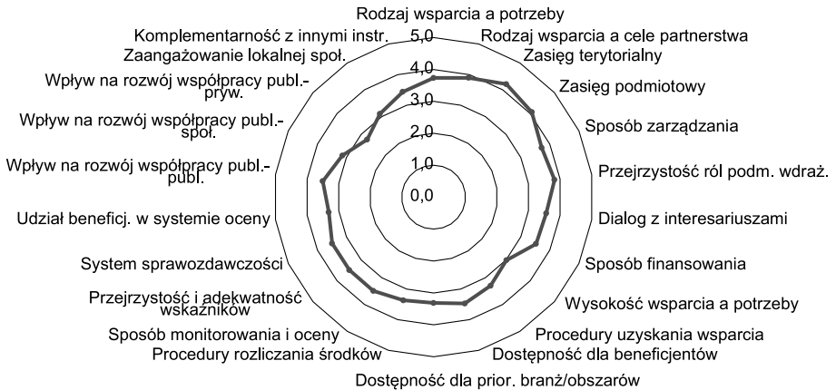
Ryc. 2. Ocena przez partnerstwa kryteriów dla wszystkich wdrażanych przez nie instrumentów terytorialnych

Źródło: Noworól i in. [2018, cz. 3: 136] (średnia arytmetyczna ocen, oceny na podstawie 57 ankiet).