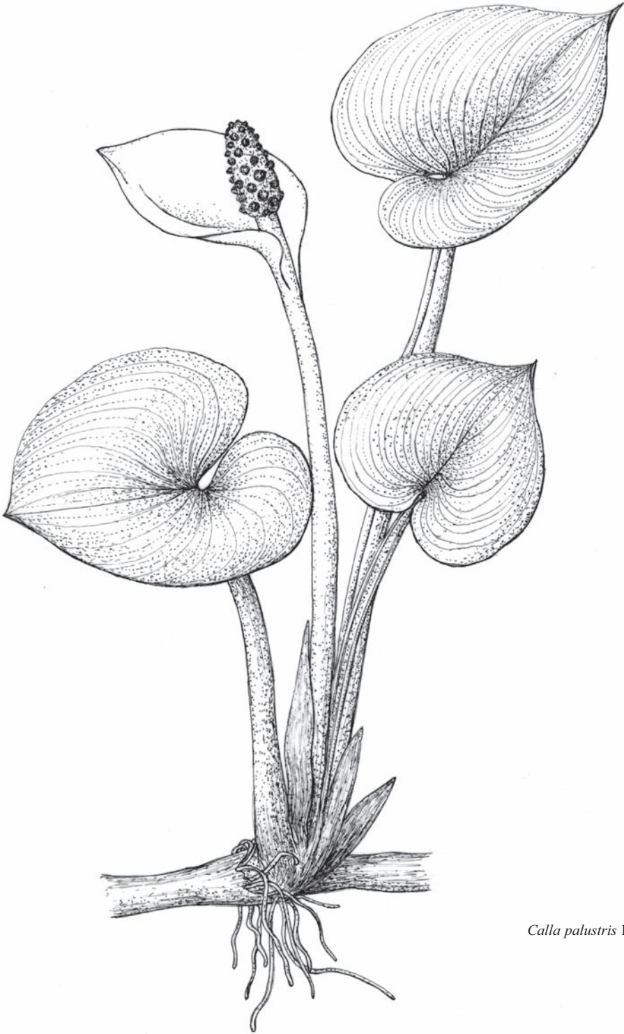
Calla palustris L.