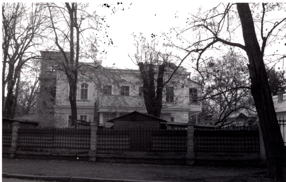
Willa generała Stahela w Odessie, stan obecny (2005).