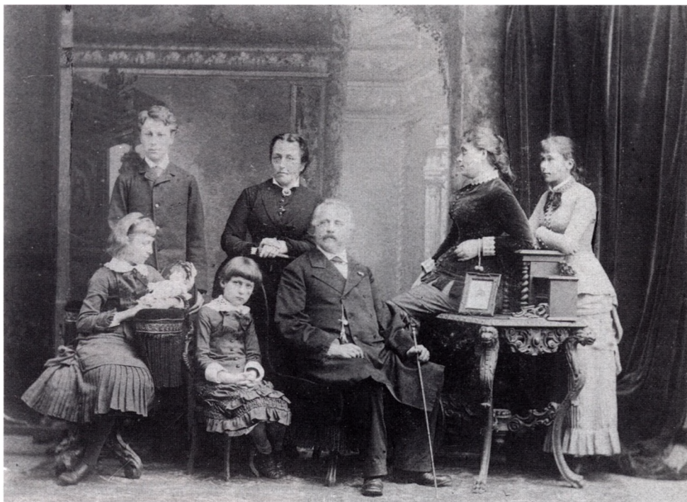
Generał Karol Stahel w otoczeniu rodziny, Odessa, ok. 1880

pochodzi z Warwarówki pod Mikołajowem („majątek hr. Lamberta”), z obszarów dawnej Olbii 2 . Był to ważny ośrodek miejski, założony u ujścia Bohu w połowie VII wieku p.n.e. przez Greków przybyłych z Miletu. Okres szczególnego rozkwitu miasto przeżywało od V do III wieku p.n.e. 3 . Olbia była zapewne przedmiotem specjalnego zainteresowania generała Stahela.