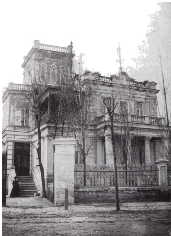
Willa generała Stahela w Odessie („Observatoryj Pereułek” Nr 9), ok. 1890–1910