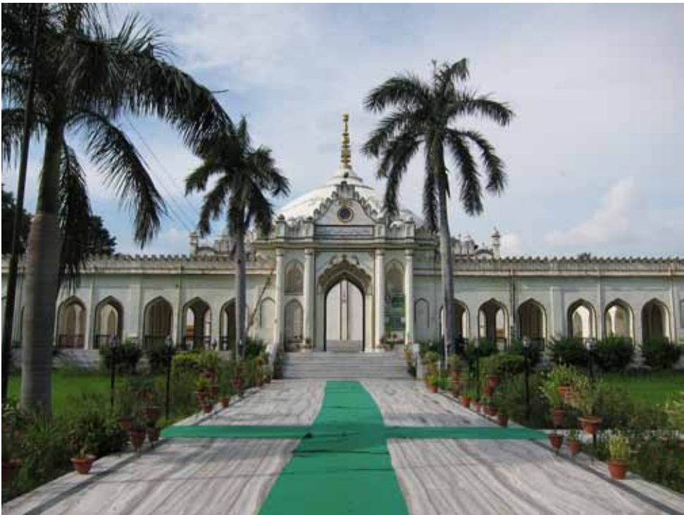
4. Imambara Śah Nadżaf , Lakhnau.

urzędowej. Najsłynniejsza i najbardziej okazała lakhnauska imambara, wybudowana w 1784 roku przez nawaba Asaf ud-Daulę i od jego imienia zwana Asafi Imambara ( Āṣafī Imāmbārā ), znana jest powszechnie jako Bara Imambara ( Barā Imāmbārā < hin./urdu barā ‘wielki’) i pod taką nazwą występuje również na mapach i w przewodnikach turystycznych. Wspomniana już wyżej i również należąca do najczęściej odwiedzanych budowli tego typu w Lakhnau Husajnabad Imambara dla odróżnienia od swej słynnej poprzedniczki jest popularnie nazywana Ćhota Imambara ( Choṭā Imāmbārā < hin./urdu choṭā ‘mały’), trzecia zaś najstarsza imambara w Lakhnau, której oficjalna eponimiczna nazwa brzmi Imambara (Nawab Salardżang Bahadur) Mirza Kasim Ali Chan Sahab [ Imāmbārā (Navāb Sālārjang Bahādur) Mirzā Qāsim ʿAlī Xān Ṣāḥab ], występuje niemal wyłącznie pod znacznie prostszą nazwą Kala Imambara ( Kālā Imāmbārā ), którą zawdzięcza kolorowi swych ścian (< hin./urdu kālā ‘czarny’).