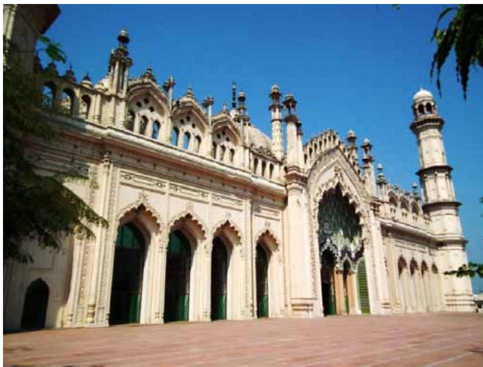
11. Fasada Dżama Masdzid w Lakhnau z bogato dekorowanym portalem i licznymi elementami zdobniczymi.

Szyickie meczety wyróżnia nadto obowiązujący w nich często zakaz wstępu dla niemuzułmanów. Tak jest m.in. w przypadku dwóch najbardziej okazałych i architektonicznie najciekawszych meczetów w Lakhnau – meczetu wybudowanego w kompleksie wielkiej imambary przez Asaf ud-Daule (Asafi Masdzid, urdu Āṣafī Masjid ) oraz meczetu kongregacyjnego (Dżama Masdzid, urdu Jāma Masjid ), które można uznać za jedne z najświetniejszych przykładów architektury sakralnej Awadhu w czasach panowania nawabów.