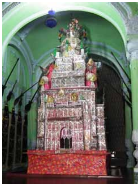
2. Symboliczna replika grobu Al-Husajna ( tazija ) i sztandary Alego przechowywane w Bara (Asafi) Imambara , Lakhnau (fot. autorki).

Indyjskie imambary, choć nawiązują do rozpowszechnionej w Iraku, Libanie czy Iranie tradycji wyznaczania specjalnych miejsc i konstruowania tymczasowych, prowizorycznych struktur (zwykle namiotów) dla celebrowania obchodów muharramowych, stanowią jednak specyficzną, wykształconą na subkontynencie innowację architektoniczną, chronologicznie wcześniejszą niż podobne budowle wznoszone od końca XVIII wieku w Iranie 14 . W zależności od regionu określa się je w Azji Południowej różnymi nazwami – w Awadhu zwykle jest to hybrydalny termin imambara [ imāmbārā < pers./ar. imām ‘przywódca religijny’ + urdu/