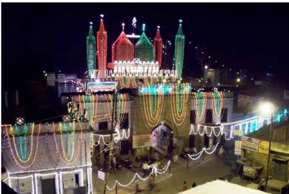
8. Rauza-e Kazimaj, Lakhnau, w pełnej iluminacji podczas obchodów muharramowych.