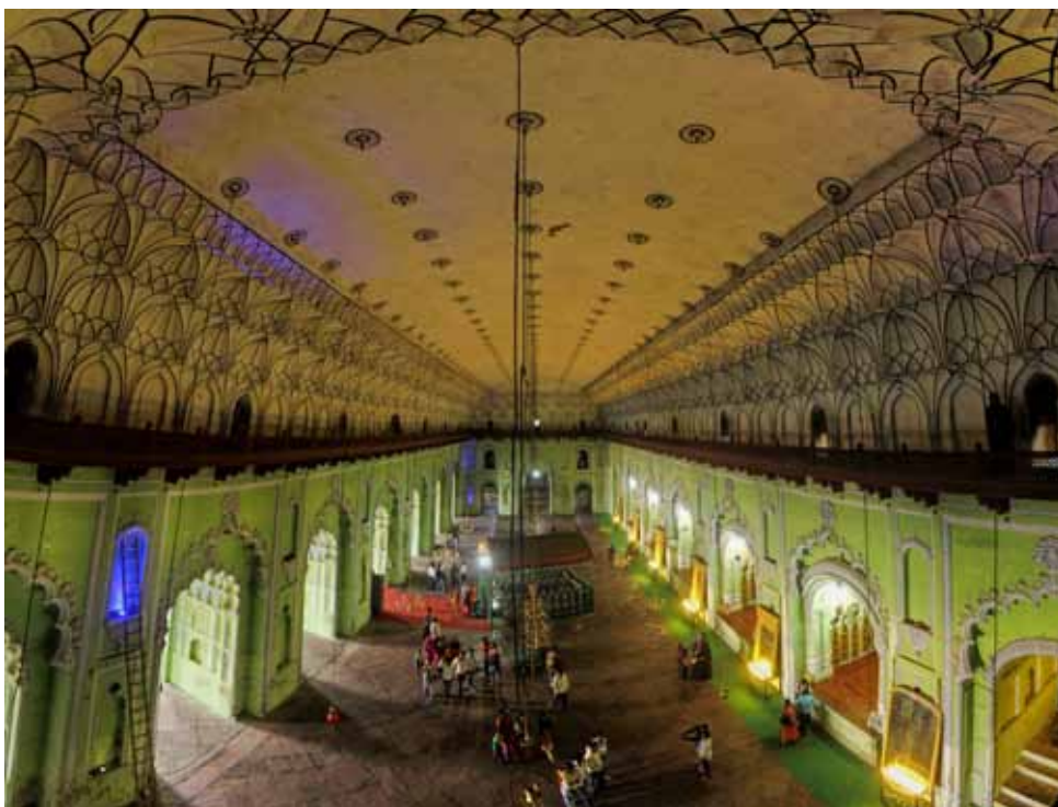
3. Bara (Asafi) Imambara , Lakhnau, widok na część centralną budowli z grobem Asaf ud-Dauli.

budowle, wznoszone przez panujących w Awadhu nawabów, wyznaczały standardy estetyczne i użytkowe dla setek innych, często znacznie mniejszych obiektów, fundowanych przez zamożnych przedstawicieli lokalnej arystokracji. Główną cechą imambar była ich przestronność – miały służyć jako miejsce dla kongregacji zwanych madżlis (pers. < ar. majlis ‘zgromadzenie, kongregacja’), mogące pomieścić rzesze wiernych, zbierających się w żałobnym nastroju wokół recytatorów elegii i przygotowujących się do odbycia tradycyjnej aszurowej procesji. Zwykle miały one postać prostokątnych, jednopiętrowych budowli, skierowanych frontem ku północnemu zachodowi – w kierunku Karbali, miejsca męczeńskiej śmierci Al-Husajna. Najczęściej wznoszone były na ok. półtorametrowej podmurówce i otoczone otwartymi werandami. Obowiązkowo obok każdej imambari budowano przypisany do niej meczet. Wewnętrzna przestrzeń „domu imama” podzielona była na trzy części – z centralną, najobszerniejszą salą przeznaczoną dla panującego i jego