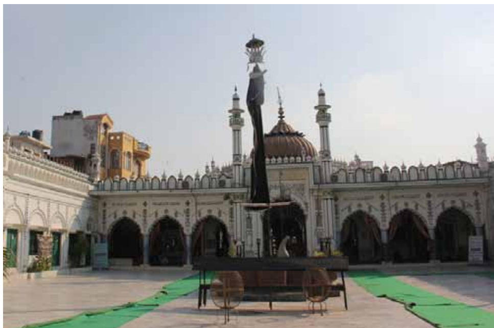
9. Dargah-e Hazrat Abbas, Lakhnau. Przed wejściem widoczny sztandar oraz symboliczna kamienna sakwa na wodę.

w Indiach, choć pozostaje nieukończona od czasu niespodziewanej śmierci jej fundatora 18 . Jednym z najważniejszych szyickich sanktuariów w Lakhnau jest Dargah-e Hazrat Abbas ( Dargāh-e Ḥazrat ʿAbbās ), inaczej Hazrat Abbas ka Dargah ( Ḥazrat ʿAbbās kā Dargāh ), upamiętniające postać przyrodniego brata i wiernego towarzysza Imama Al-Husajna. Dargah (< pers. dargāh ‘dwór królewski; sanktuarium’) należy do najstarszych szyickich budowli sakralnych w Awadhu. Ta pierwotnie niewielka konstrukcja, powstała w okresie panowania Asaf ud-Dauli, została rozbudowana później do dzisiejszej okazałej postaci przez szóstego nawaba-wezyra, Sa’adata Alego Chana II. Jak głosi legenda, sanktuarium założono w miejscu odnalezienia brązowego zwieńczenia sztandaru, alam (< ar. ʿalam ‘znak, symbol’) w kształcie dłoni, panđza (< pers. panja h ), które miał wskazać pewnemu biedakowi we śnie sam Abbas Ibn Ali. Budowla i jej rozplanowanie utrzymane są zasadniczo w stylu