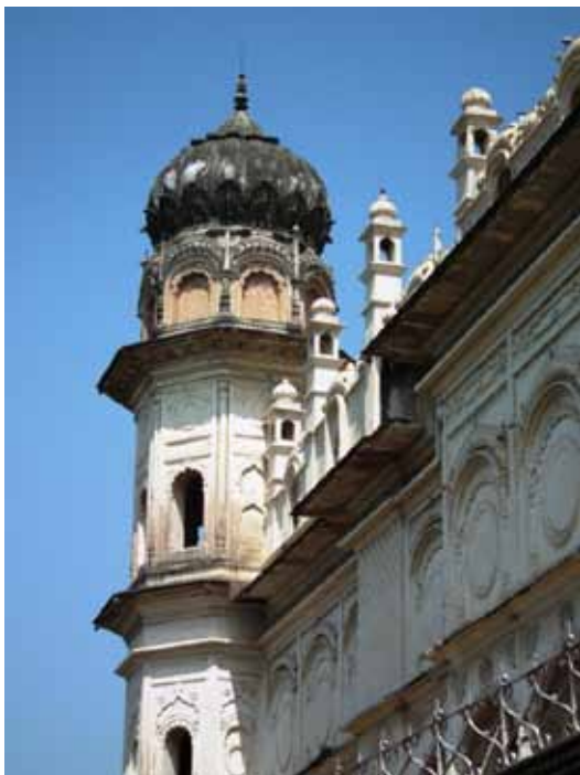
6. Bahū Begam ka Makbara, Fajzabad, widoczne dekoracje elewacji i dachu.