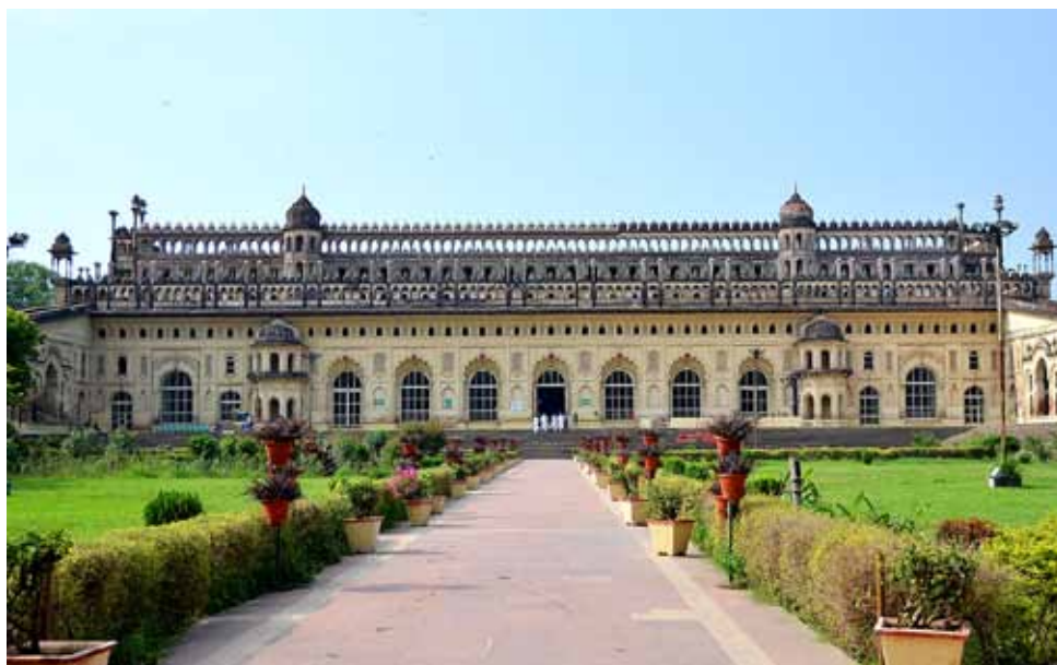
5. Bara (Asafi) Imambara, Lakhnau.