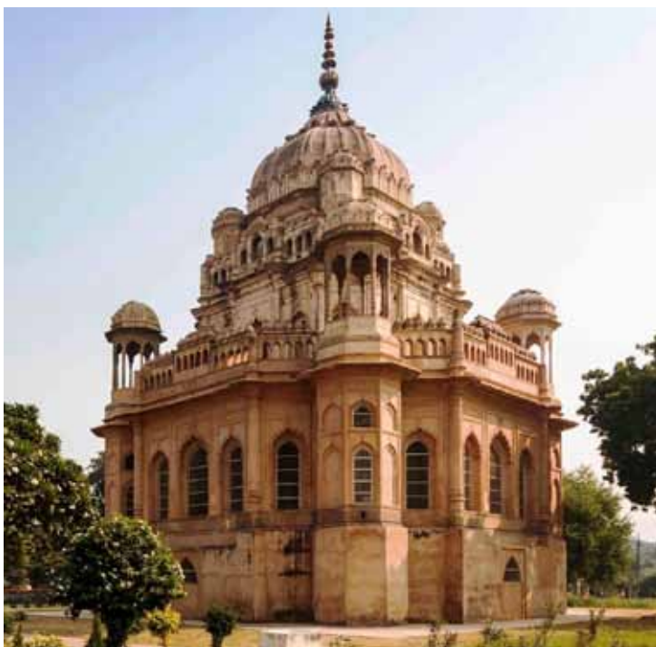
7. Muršid Zadi ka Makbara , Lakhnau (fot. autorki).

znawców uznawane są za arcydzieła, przewyższające swym kunsztem nawet spektakularne imambary 17 .