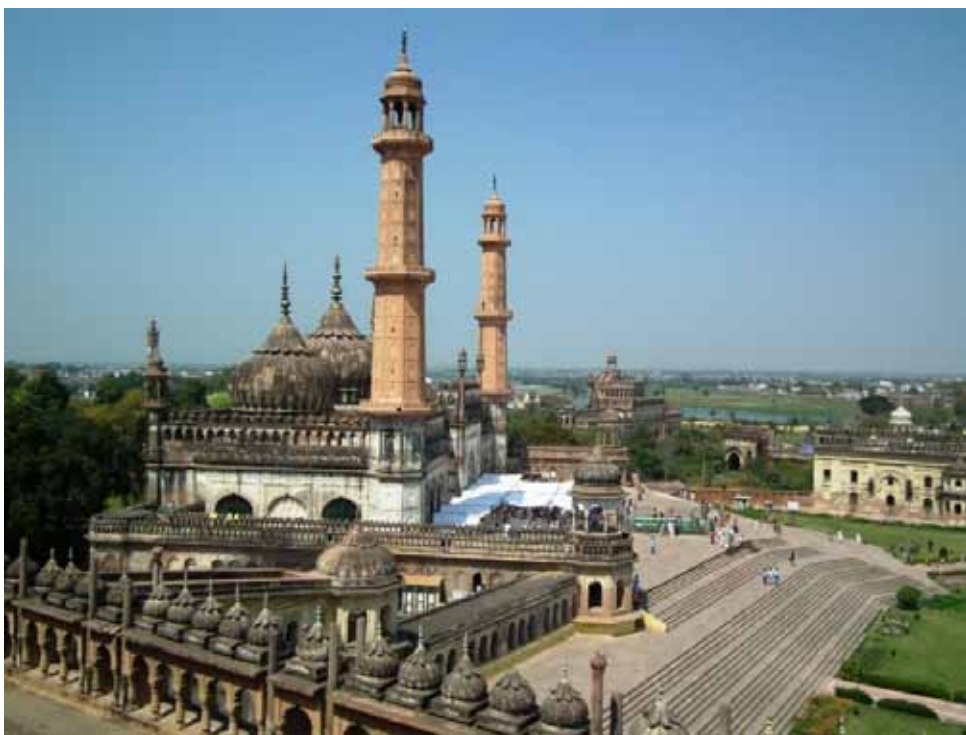
10. Asafi Masdzid , Lakhnau, w trakcie przygotowań do popołudniowej modlitwy piątkowej.

islamu, zaś w Awadhu zyskały dodatkowe znaczenie, bowiem – jak już wspomniano – każdej imambarze musiał towarzyszyć przypisany do niej meczet (przejmujący też zwykle nazwę imambary). Większość z nich, bez względu na rozmiar, posiada cechy wspólne, takie jak: