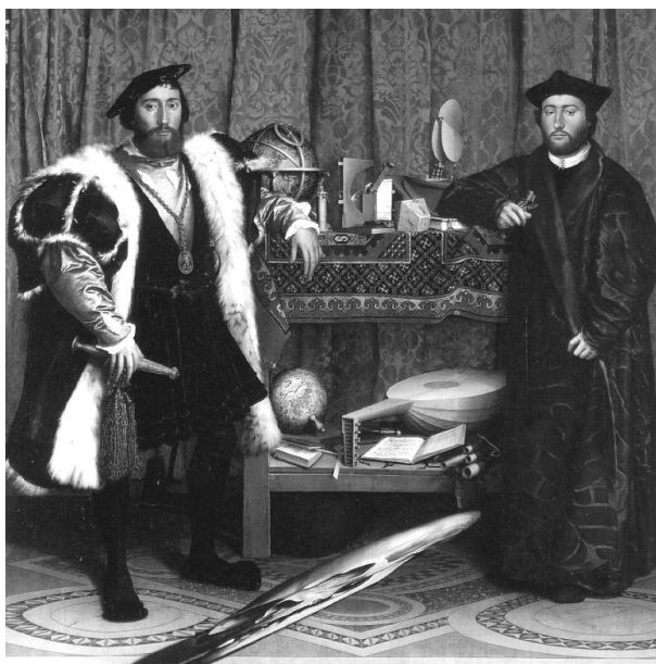
Ryc. 2. Hans Holbein, The Ambassadors , 1533 Londyn, National Gallery