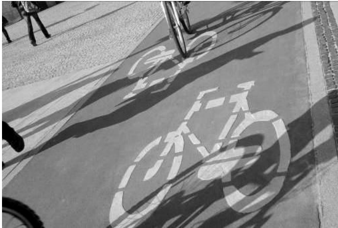
Rys. 5. Anamorfoza płaszczyznowa