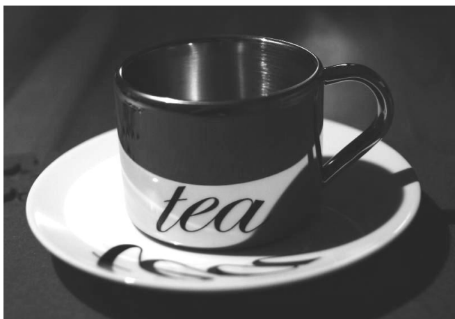
Ryc. 6. Anamorficzna filiżanka