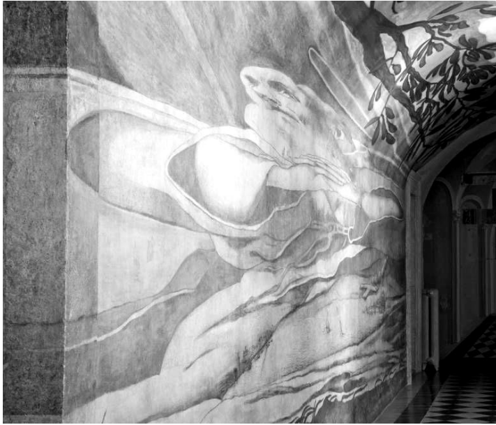
Ryc. 3. Emmanuel Maignan, Św. Franciszek z Paoli , 1642 Rzym