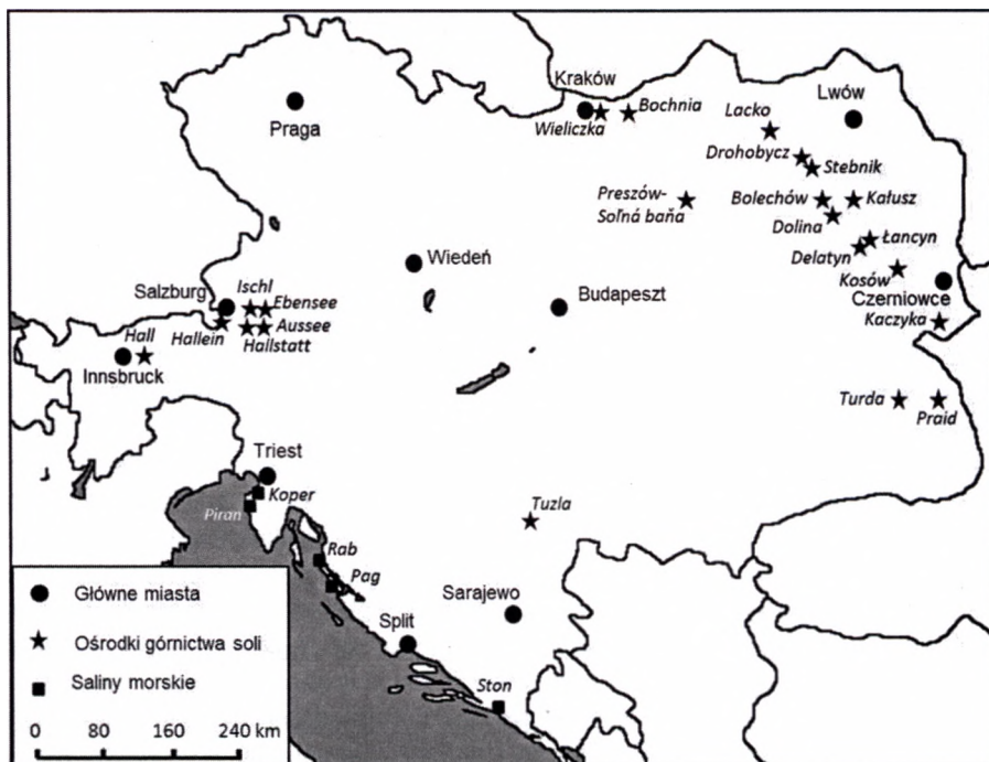
Ryc. 1. Ośrodki eksploatacji soli na terenie Austro-Węgier na początku XX w.