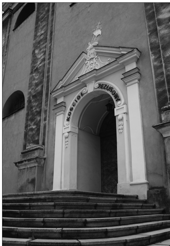
Fot. 2. Główne wejście do kościoła Jezusowego (Łaski).

Haus i Grete Tumsers glückliches Jahr. W „Beskiden Kalender” od 1955 do 1969 roku ukazywały się jej artykuły dotyczące Cieszyna i okolic.