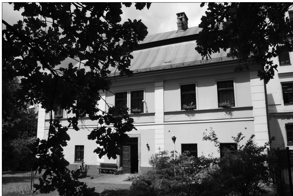
Fot. 3. Plebania, w której mieszkał ksiądz Kłapsia (powieściowy pastor Kattenschlag).

ojciec, a później – czynią to dzieci. Studiują Biblię i klasyczną literaturę niemiecką. Z domu wynieśli skromność i przekonanie, że najważniejszym bogactwem człowieka jest wiedza i praca.