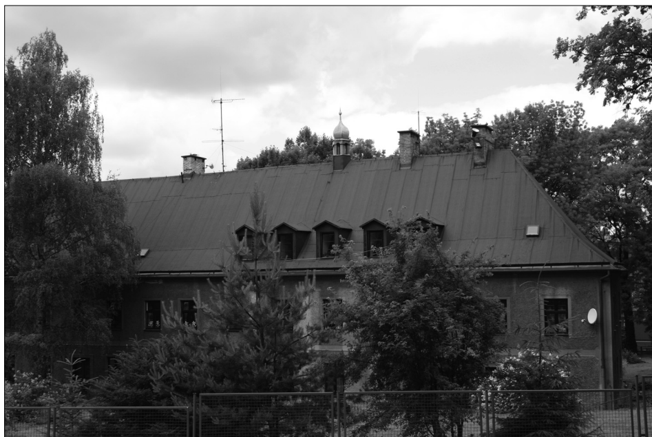
Fot. 5. Budynek dawnej szkoły ewangelickiej zwany „pajta”.

jej przejawem był podział na niemieckich mieszczan dbających o kulturę i śląsko-polskich rolników dbających o naturę).