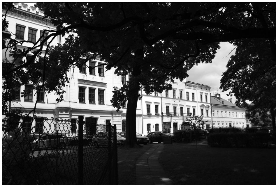
Fot. 4. Część placu Kościelnego, gdzie mieściło się gimnazjum ewangelickie i alumneum.

i pobierała życiowe nauki: „U starki nauczyłaś się naszej pięknej rzeczy (gwary), co też starka pilnowała, bych tam mówiła po naszymu” 43 . A w cieszyńskim domu z kolei jej matka chrzestna, Magdalena Kotulowa, wdowa po księgarzu, poprawiała ją, gdy powiedziała coś niepoprawnie po polsku 44 .