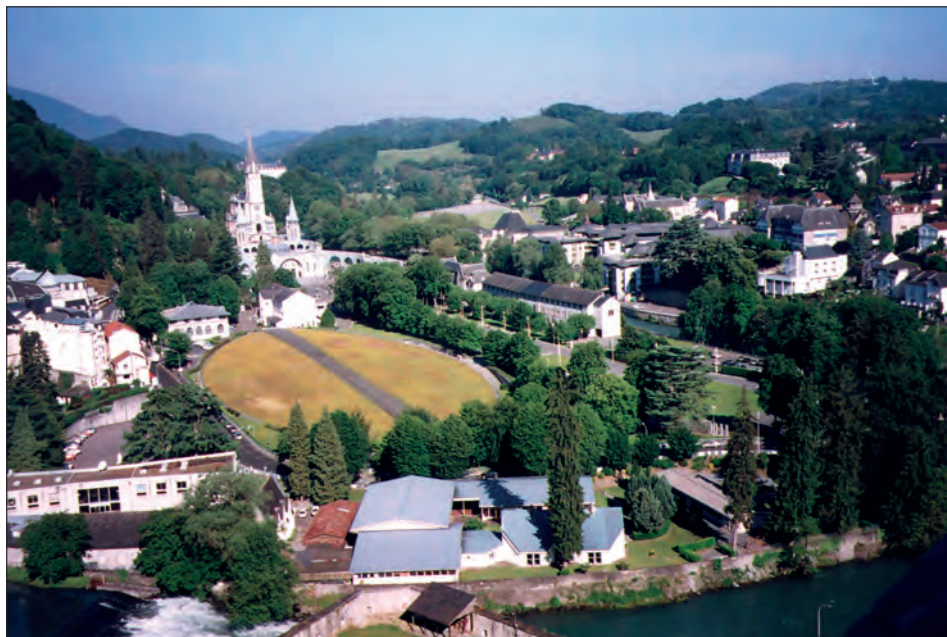
Fot. 4. Sanktuarium w Lourdes. Bazylika podziemna Piusa X