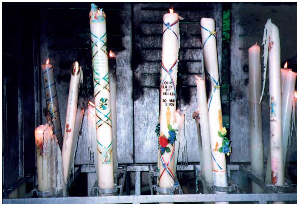
Fot. 6. Świece wotywnne w pobliżu Groty Masabielle