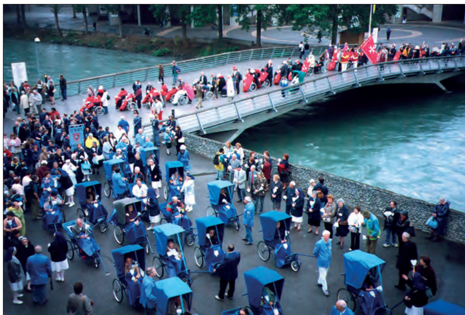
Fot. 5. Pielgrzymka chorych (fot. D. Ptaszycka-Jackowska)