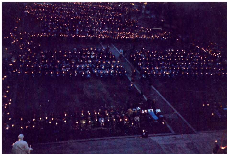
Fot. 7. Procesja różańcowa ze światłem