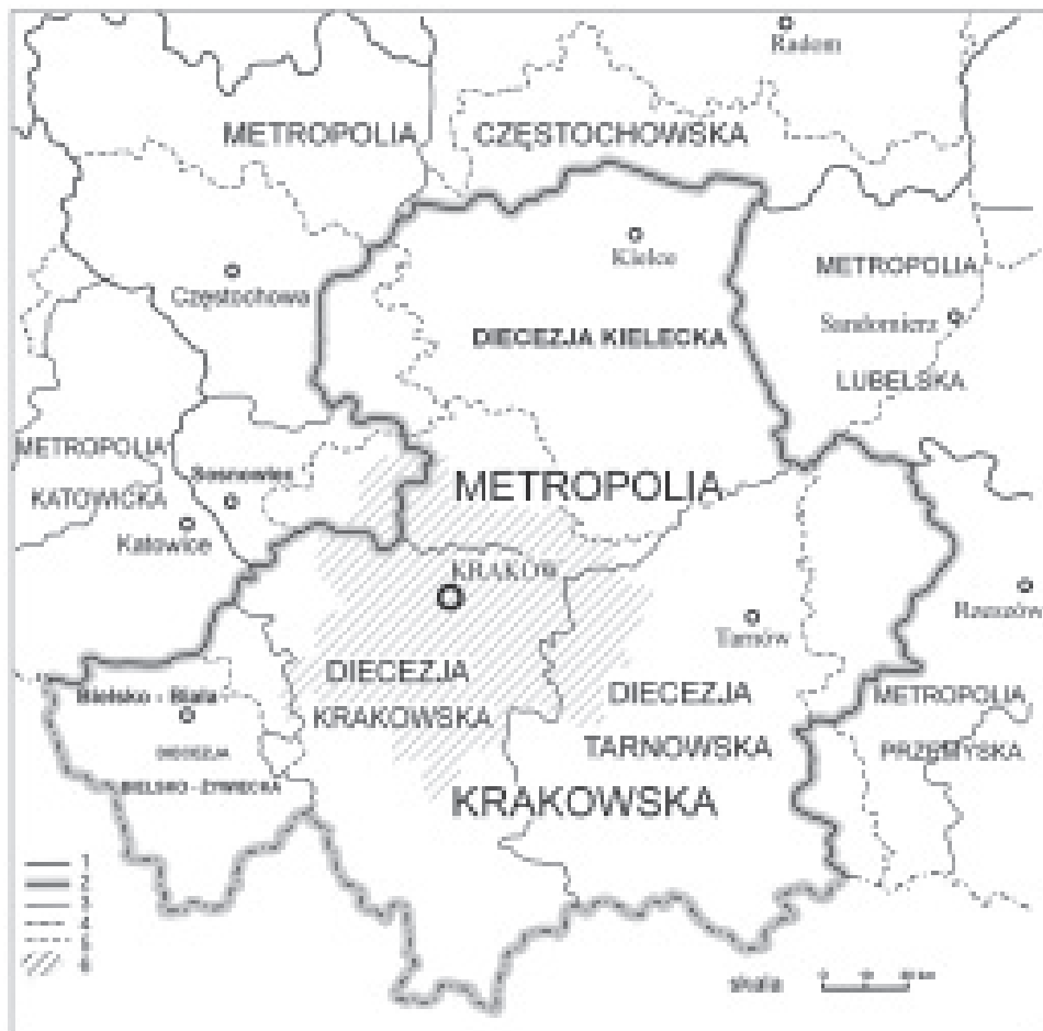
Ryc. 2. Metropolia Krakowska

1 – granice metropolii po 1992 r., 2 – granice metropolii krakowskiej po 1992 r., 3 – granice diecezji po 1992 r., 4 – granica państwa, 5 – granice województw po 1999 r., 6 – Krakowski Obszar Metropolitalny (KOM).