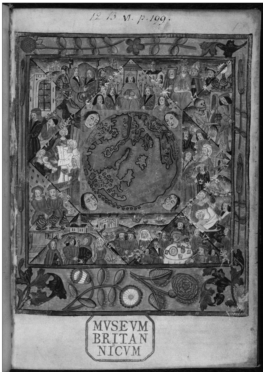
3. Prognostyk z wpisanym horoskopem Henryka VIII, króla Anglii. Miniatura w rękopisie De optimo fato Wilhelma Parrona, wykonana w Londynie, koniec wieku XV. Royal 12 B., VI, f.1.