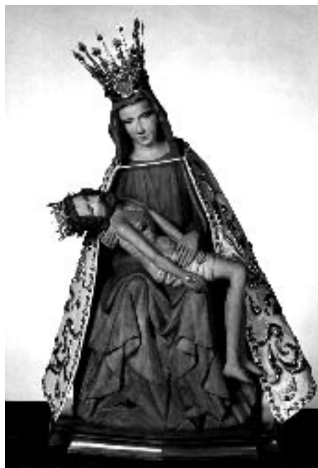
Fot. 2. Cudowna figura Matki Bożej Bolesnej

Sanktuarium limanowskie troszczy się o formę i treść kultu. Spośród innych miejsc wyróżniają go charakterystyczne nabożeństwa. Przykładem są Godzinki o Matce Bożej Bolesnej ułożone na wzór Godzinek o Niepokalanym Poczęciu Najświętszej Maryi Panny , w dwóch wersjach: rozważanie siedmiu boleści Matki