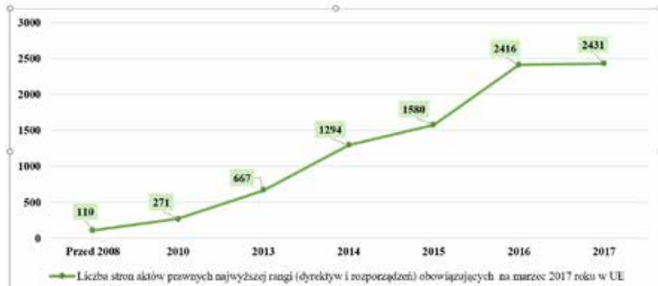
Wykres 1. Liczba stron pokryzysowych regulacji bankowych (aktów prawnych oraz wniosków legislacyjnych) opublikowanych w UE w latach 2008-2017

Źródło: opracowanie własne na podstawie EU Mapping 2017: Systematic overview on economic and financial legislation, s.13 [online], dostępny w Internecie: http://www.europarl.europa.eu/RegData oraz EUR-Lex Baza aktów prawnych Unii Europejskiej [online], dostępny w Internecie: https://eur-lex.europa.eu/legal-content/