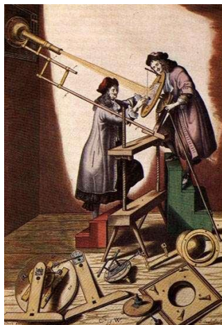
Luneta do obserwacji Słońca metodą projekcji. Rycina z dzieła Heweliusza Machinae coelestis pars prior (Gdańsk 1673)

Czytając życiorys Heweliusza można zapomnieć, iż żył on 400 lat temu w zupełnie innej niż współczesna Europie. W czasach, w których nie jeździły pociągi, nie latały samoloty, nie było telefonów, a i poczta dopiero raczkowała. Tymczasem Heweliusz był niesłychanie nowoczesny. Genialnie łączył pracę naukową ze społeczną (był rajcą) i z prowadzeniem interesów (browary).