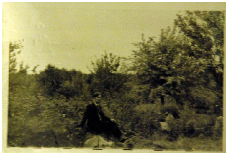
Fot. 3. Ryszard Bitowt na gruzach majątku w Białozoryszkach na Wileńszczyźnie (1956)