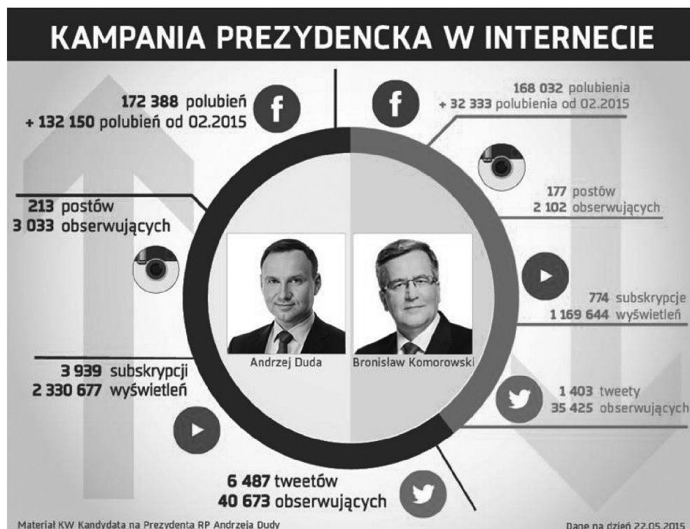
Infografika 1. Materiał wyborczy KW Andrzeja Dudy