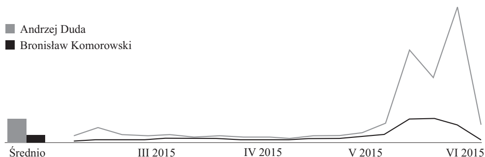
Wykres 1. Liczba zapytań dla hasel „Andrzej Duda” i „Bronisław Komorowski” w wyszukiwarce Google (luty–czerwiec 2015)