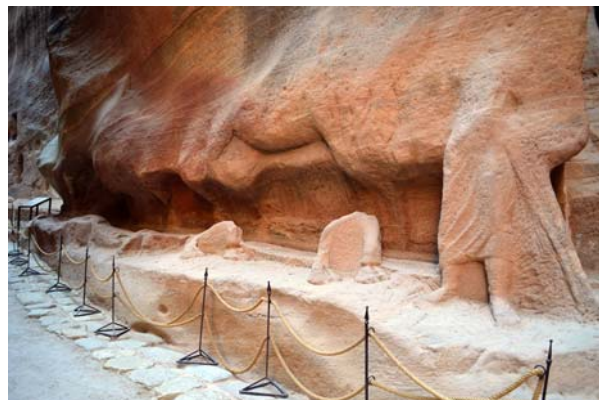
Ryc. 10b. Naturalnej wielkości, częściowo zachowany relief przedstawiający pięć wielbłądów oraz ich poganiaczy, Siq, Petra Fig. 10b. Life-sized, partially preserved relief of five camels and their drivers, Siq, Petra