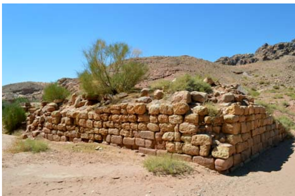
Ryc. 9. Elementy nabatejskiego systemu hydrologicznego, Wadi Sabra, region Petry Fig. 9. Elements of the Nabataean water management system, Wadi Sabra, Petra region

szereg projektów, których celem była analiza konserwatorska stanu zachowania budowli skalnych i wolnostojących, a także badania wpływu warunków środowiskowych na tempo procesów wietrzenia, badania składu i sposobu zachowania zapraw używanych do konstruowania budowli kamiennych czy analizy wpływu substancji chemicznych używanych podczas zabiegów konserwatorskich na materiały kamienne używane przez Nabatejczyków. W latach 1996-1999 przeprowadzono kompleksowe prace badawcze, których celem było określenie przebiegu procesów wietrzenia obiektów wykutych w skałach i zaproponowanie nowoczesnych rozwiązań konserwatorskich. Zanalizowano 22 budowle na terenie Petry i dokonano ciekawych obserwacji, proponując w efekcie szereg rozwiązań zależnych od materiału skalnego, stopnia uszkodzeń budowli i skały projektowanych prac [6, 7]. Ważnych efektów dostarczyły także prace prowadzone na terenie rzymskiego teatru znajdującego się w Petrze, które pomogły zrozumieć procesy erozyjne zachodzące