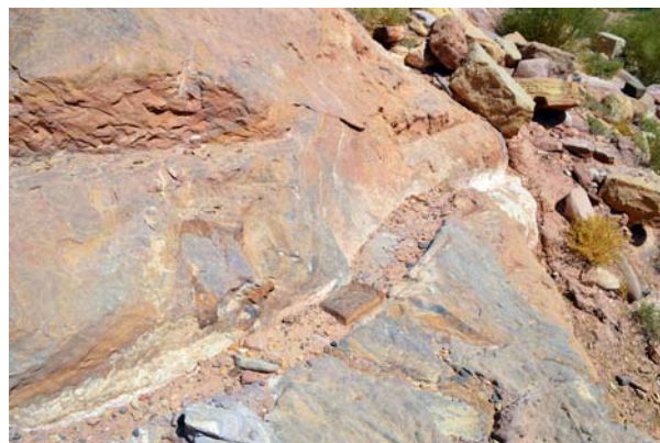
Ryc. 12b. Relikty kanału doprowadzającego wodę w rejonie tzw. Akropolu, Wadi Sabra