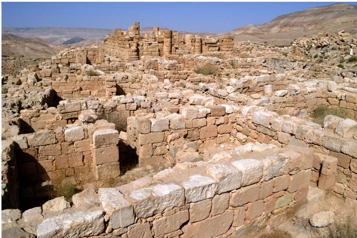
Ryc. 8. Nabatejska świątynia w Khirbet-Darih, Wadi al-Hasa Fig. 8. Nabataean temple at Khirbet-Darih, Wadi al-Hasa