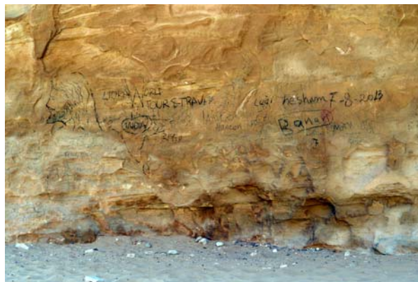
Ryc. 19. Współczesne napisy na ścianie nabatejskiego triklinium, Siq al-Barid (Mała Petra)

Fig. 18. The interior of Sextus Florentinus rock-cut tomb used as a stable, Petra