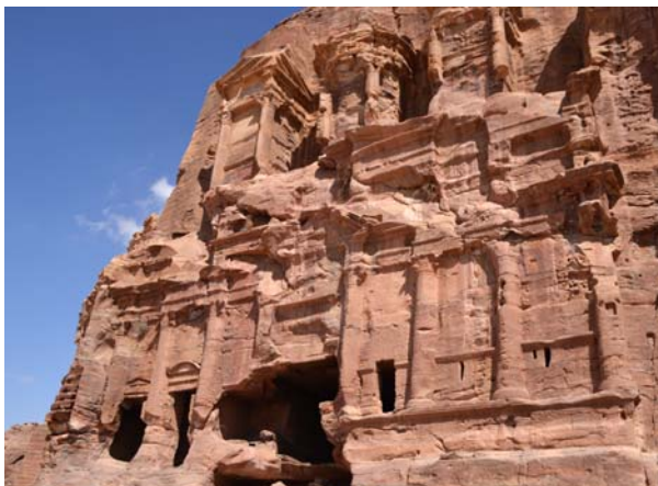
Ryc. 15. Fasada grobowca Korynckiego, Petra Fig. 15. The façade of Corinthian Tomb, Petra