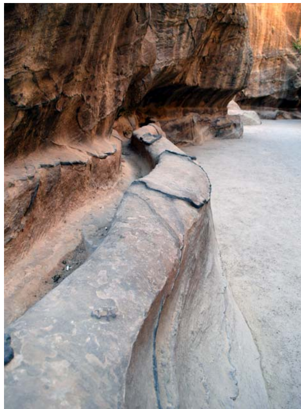
Ryc. 12a. Kanały doprowadzające wodę do centrum Petry ze źródeł Ain Musa wykute w skałach po obu stronach Siq'u (Źródło Mojżesza, kilka kilometrów na wschód od Petry)