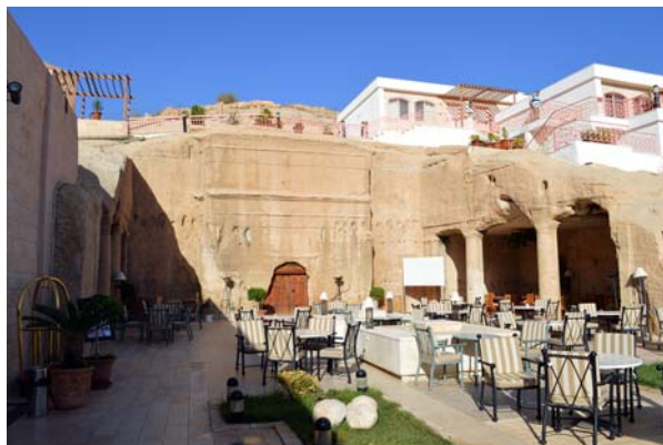
Ryc. 17. Grobowiec El Khana znajdujący się przy wejściu do Bab As Siq, wykorzystany przez Petra Quest House Hotel jako bar, Petra Fig. 17. El Khan Tomb located at the main entrance gate to Bab As Siq, used by Petra Quest House Hotel as a bar, Petra