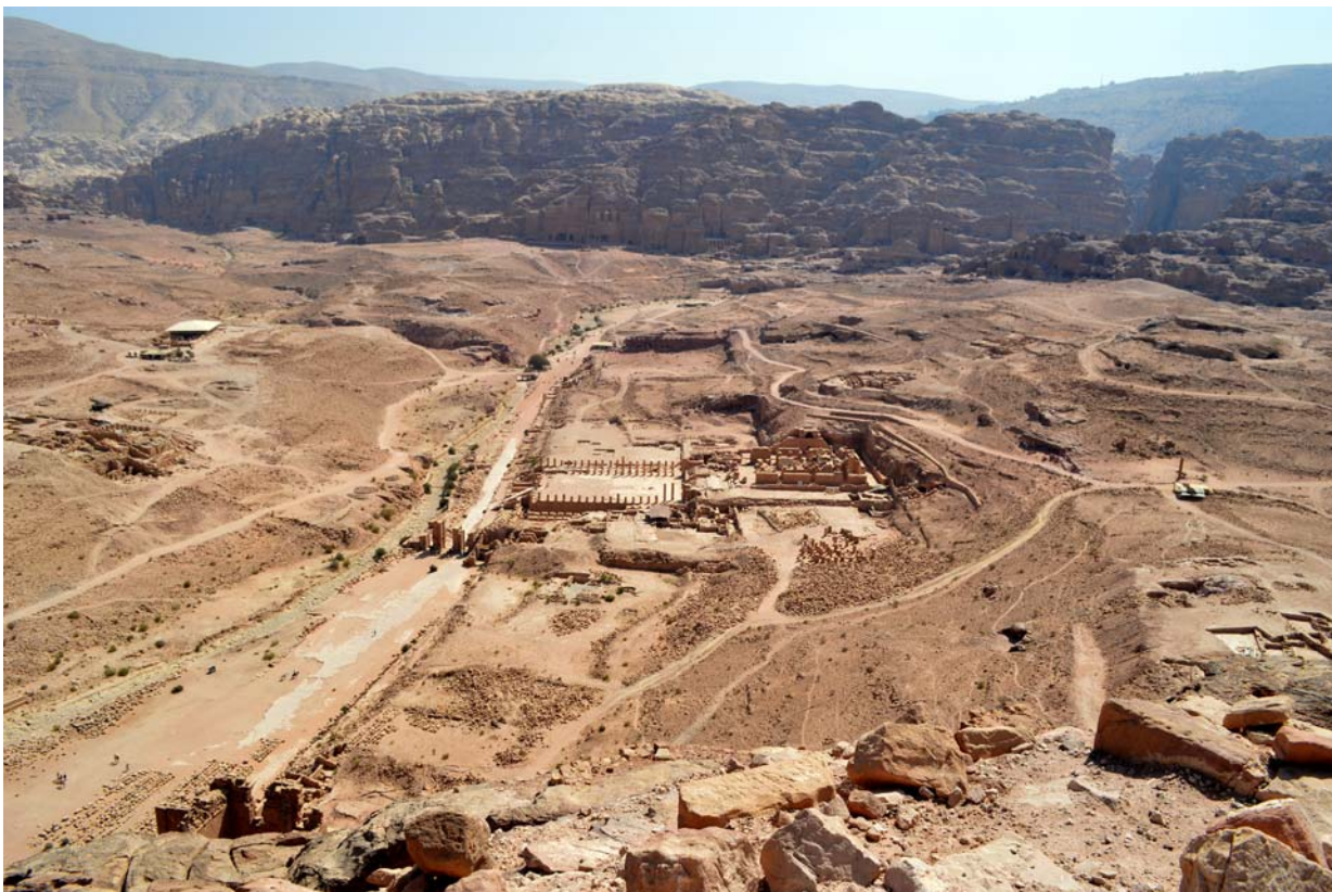
Ryc. 20. Centrum Petry

Fig. 19. Modern writing on the wall of Nabataean triclinium, Siq al-Barid (Little Petra)