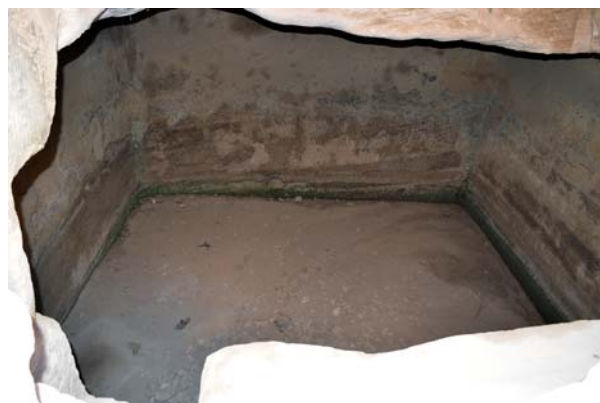
Fig. 12b. Water channels at Wadi Sabra Acropolis