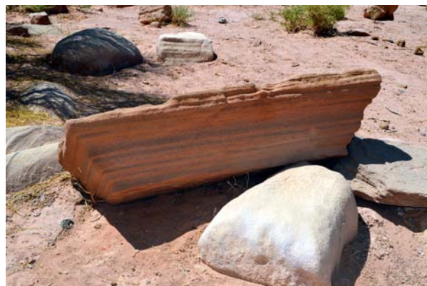
Ryc. 10c. Detal architektoniczny zniszczony przez procesy erozyjne, Wadi Sabra, region Petry Fig. 10c. Architectural detail destroyed by erosion processes, Wadi Sabra, Petra Region

as well as research on the influence of environment conditions on the velocity of the erosion processes, examination of content and behaviour of mortars used in construction of stone buildings, or the analysis of the effect of chemical substances used during conservation treatment on stone materials used by the Nabataeans. In the years 1996-1999, complex research work was carried out, the aim of which was determining the course of erosion processes affecting the objects carved in rocks and proposing modern conservation solutions. 22 buildings in Petra have been analysed and interesting observations have been made which resulted in suggestions of several solutions