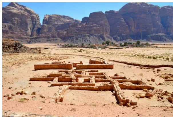
Ryc. 5. Nabatejska świątynia bóstwa Allat, Wadi Rum Fig. 5. Nabataean temple of Allat, Wadi Rum