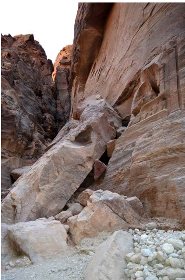
Ryc. 16. Fasada triklinium zniszczonego przez trzęsienie ziemi, Petra Fig. 16. Façade of triclinium destroyed by earthquake