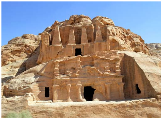
Ryc. 3. Fasada grobowca „Obelisków”, Petra Fig. 3. Obelisk Tomb façade, Petra