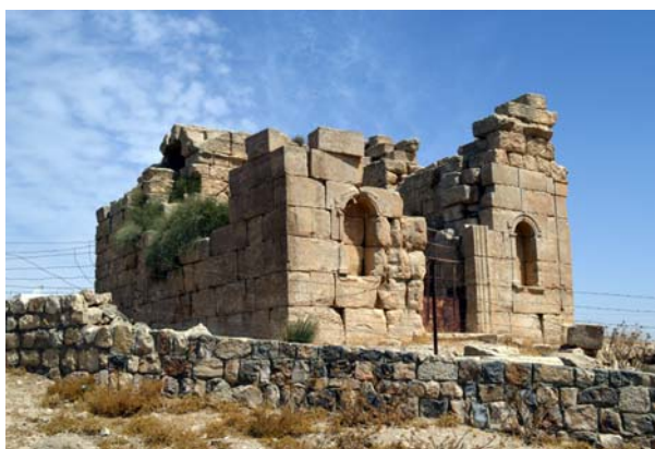
Ryc. 6. Nabatejska świątynia w DhatRas (okolice Keraku) Fig. 6. Nabataean temple at DhatRas (near Kerak)