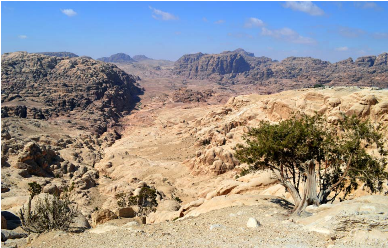
Ryc. 1. Widok na skały Petry z rejonu Al-Wueyra Fig. 1. View of the Petra rocks from the Al-Wueyra region