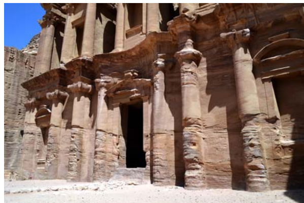
Ryc. 10a. Dolne partie fasady Deir (Klasztor) zniszczone przez procesy erozyjne – działanie wiatru, Petra Fig. 10a. The lower part of the Deir façade destroyed by weathering processes, Petra

szereg projektów, których celem była analiza konserwatorska stanu zachowania budowli skalnych i wolnostojących, a także badania wpływu warunków środowiskowych na tempo procesów wietrzenia, badania składu i sposobu zachowania zapraw używanych do konstruowania budowli kamiennych czy analizy wpływu substancji chemicznych używanych podczas zabiegów konserwatorskich na materiały kamienne używane przez Nabatejczyków. W latach 1996-1999 przeprowadzono kompleksowe prace badawcze, których celem było określenie przebiegu procesów wietrzenia obiektów wykutych w skałach i zaproponowanie nowoczesnych rozwiązań konserwatorskich. Zanalizowano 22 budowle na terenie Petry i dokonano ciekawych obserwacji, proponując w efekcie szereg rozwiązań zależnych od materiału skalnego, stopnia uszkodzeń budowli i skały projektowanych prac [6, 7]. Ważnych efektów dostarczyły także prace prowadzone na terenie rzymskiego teatru znajdującego się w Petrze, które pomogły zrozumieć procesy erozyjne zachodzące