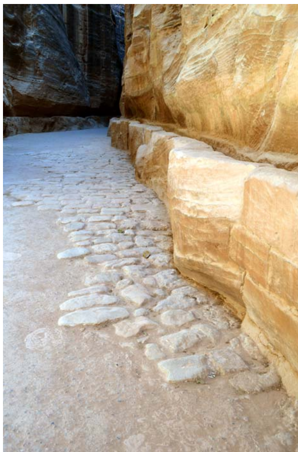
Ryc. 17b. Fragment oryginalnej, kamiennej posadzki Siq'u, Petra 17b. A fragment of the original stone-floor of Siq, Petra

codziennie przez Siq i centrum Petry, wspinających się do „Klasztoru” (Deir) położonego ponad doliną, zasiadających w rozrastających się tutaj kawiarniach i pozostawiających śmieci wpływa niekorzystnie na stan zachowania zabytków. Dodatkowo ruch turystyczny generuje wielki rozwój usług oferowanych w tym rejonie (ryc. 17a) przez miejscowych sprzedawców, przewoźników i przewodników. Setki turystów jest codziennie wożonych niewielkimi bryczkami lub na osiołkach po zachowanych fragmentach oryginalnego bruku Siq'u (ryc. 17b) czy wykutych w miękkiej skale stopniach prowadzących do „Klasztoru” (Deir), co powoduje ich powolne zanikanie pomimo zabiegów konserwatorskich wdrażanych