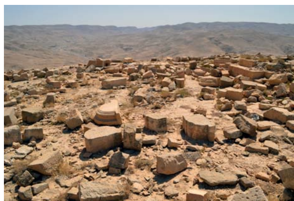
Ryc. 7. Nabatejska świątynia w Khirbet et-Tannur, Wadi al-Hasa Fig. 7. Nabataean Temple at Khirbet et-Tannur, Wadi al-Hasa