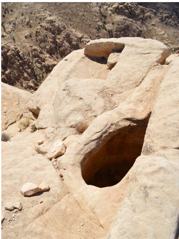
▲► Ryc. 13-14. Nabatejskie cysterny wykute w skałe, Sela i Siq al-Barid (Mała Petra) Fig. 13-14. Rock-cut Nabataean water tanks, Sela and Siq al-Barid (Little Petra)