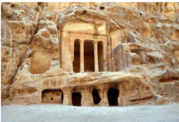
Ryc. 4. Triklinium w Siq al-Barid (Mała Petra), region Petry Fig. 4. A triclinalium at Siq al-Barid (Little Petra), Petra region