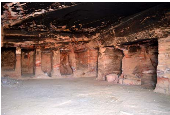
Ryc. 18. Wnętrze grobowca Sextusa Florentinusa wykorzystywane jako stajnia, Petra

Fig. 18. The interior of Sextus Florentinus rock-cut tomb used as a stable, Petra