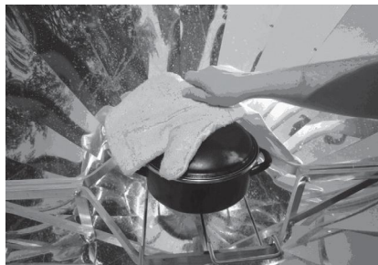
Fot. 4. Prażenie kukurydzy

Do czarnego, żeliwnego garnka wlewają trochę oleju, wysypują kukurydzę, nakrywają i ustawiają w centrum kuchenki słonecznej (fot. 2, 4). Po kilku minutach słyszą „strzelające” ziarna kukurydzy. Uczniowie wyjaśniają, że to zwiększająca wielokrotnie swoją objętość parująca woda rozrywa ziarna. Uczniowie odkrywają, że energia ze słońca skupiona w kuchence na pochłaniającym ją czarnym garnku uprażyła im kukurydzę. Po uprażeniu kukurydzy nastąpiła jej degustacja (fot. 5.).