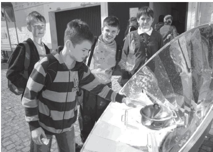
Fot.2 Kuchenka słoneczna