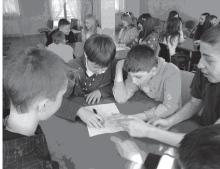
Fot.1 Uczniowie w zespołach rozwiązywali problemy

Następnie uczestnicy wycieczki przeszli na zewnątrz budynku, gdzie z pomocą gospodarza obiektu i tablic informacyjnych zapoznali się z pracującymi w ośrodku urządzeniami bazującymi na odnawialnych źródłach energii: