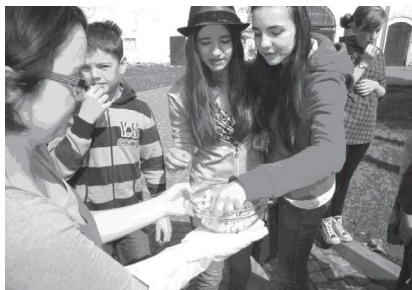
Fot. 5. Degustacja uprażonej kukurydzy

W stawie przy ośrodku uczniowie obserwowali wygrzewające się w słońcu i pływające w wodzie żółwie. Na koniec zajęć uczniowie stwierdzili, że są naładowani dobrą energią.