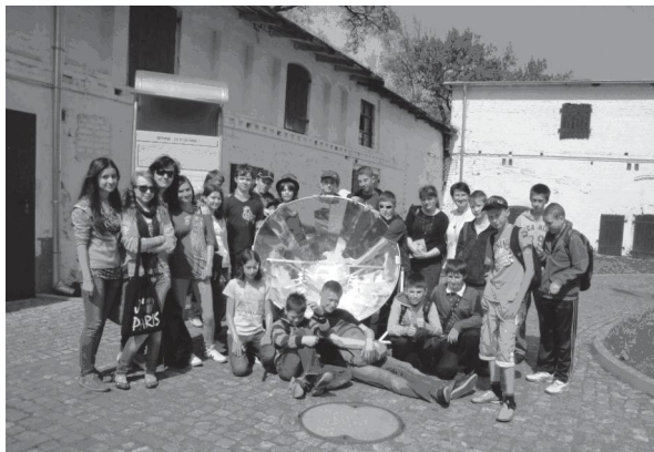
Fot.6 „Naładowani dobrą energią” przy słonecznej kuchence

W stawie przy ośrodku uczniowie obserwowali wygrzewające się w słońcu i pływające w wodzie żółwie. Na koniec zajęć uczniowie stwierdzili, że są naładowani dobrą energią.