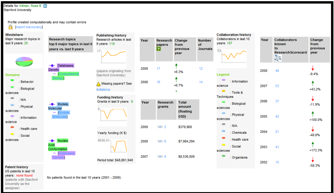
Rys. 1. ResearchScorecard – system wspomagający zarządzanie reputacją

sze (granty), historię współpracy z innymi uczonymi oraz uzyskane patenty. Baza danych i związane z nią narzędzia eksploracji danych służą kompleksowej ocenie działalności naukowej, co ułatwia znalezienie partnerów do współpracy naukowej. Niestety, serwis nie należy do otwartej nauki, prowadzi działalność komercyjną.