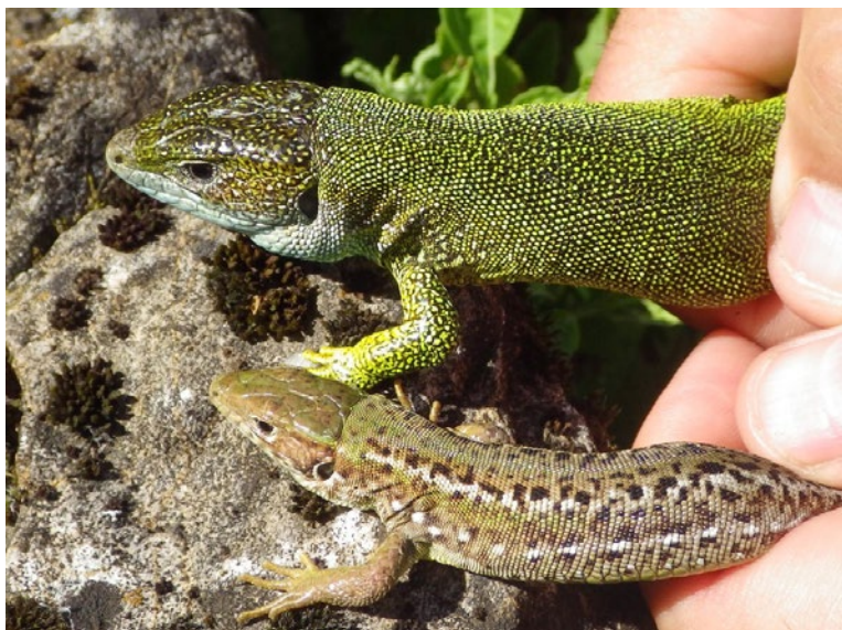
Fot. 2. U jaszczurek w okresie po-rozrodczym nadal wyraźnie widoczny jest dymorfizm płciowy – osobniki z populacji na wschodzie Słowacji, odłowione przez Igora Majlátha, zezwolenie nr 5498/2011-2.2, Ministerstwo Środowiska Republiki Słowackiej (lipiec 2017).

Photo 1. A pair of European green lizards during the mating season (male in its mating colouration) from a relic population in the Prague Zoo (May 2018).