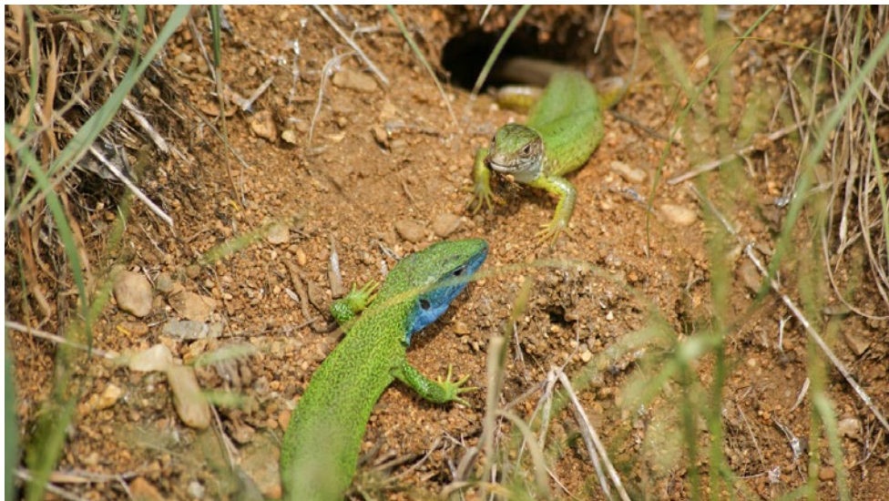
Fot. 1. Para jaszczurek zielonych w okresie godowym (samiec w widocznej szacie godowej) – reliktowa populacja na terenie ogrodu zoologicznego w Pradze (fot. M. Szkudlarek; maj 2018).

Photo 1. A pair of European green lizards during the mating season (male in its mating colouration) from a relic population in the Prague Zoo (photo by M. Szkudlarek; May 2018).