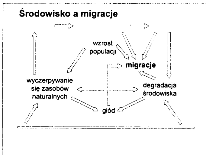
Rys. 1. Środowisko a migracje

Wybory jednostek nie są jednak niezależne od uwarunkowań globalnych i makrostrukturalnych świata. Indywidualne decyzje emigracyjne przeistaczają się w decyzje milionów ludzi, którzy najczęściej pragną uciec od biedy i poprawić swoje warunki życia. Tak więc oprócz proaktywnych migrantów przez cały świat przelewa się wielka fala migrantów reaktywnych (Richmond 2002a). Czy jednak mogą zrealizować swoje pragnienia poprawy warunków życia i uzyskania satysfakcjonującej wolności?