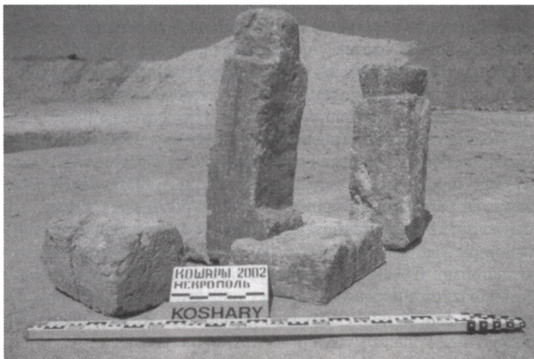
6. Koszary, nekropola, kamienne stele antropomorficzne i oltarz ofiarny z grobu 194.