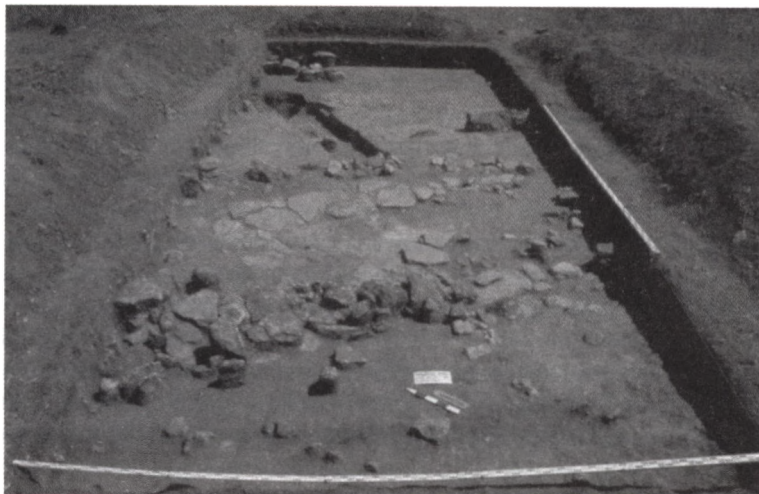
3. Koszary, osada, widok ogólny wykopu VI.

Mieszkańcy osady parali się uprawą roli, rybołówstwem (prawdopodobnie także na sprzedaż), tkactwem i innymi zajęciami, jak handel i wymiana, o czym świadczą spore ilości importowanych obiektów, przede wszystkim ceramiki. Amfory z winem i innymi produktami pochodzą z kolonii greckich nad Morzem Czarnym, jak Herakleja Pontyjska, Synope i Chersonesz Taurydzki, ale też z greckiej wyspy Tazos i innych ośrodków. Luksusową zastawę stołową sprowadzano z Aten (ceramika czarnopokostowana i czerwonofigurowa) i Azji Mniejszej. Z Olbii pochodzą monety, naczynia i być może inne obiekty. Relacjonowane badania wskazują też na ścisłe związki pomiędzy miejscową „barbarzyńską” scytyjską a grecką ludnością. Ich koegzystencja wyraźnie widoczna jest w materialnych pozostałościach (np. spore ilości lepionej ręcznie ceramiki o tradycji miejscowej, scytyjskiej) oraz w praktykach grzebalnych, do czego wrócimy poniżej.