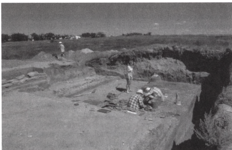
4. Koszary, badania na odkrytym ołtarzu ofiarnym – escharze.

Prace przeprowadzone na kopcu w Koszarach (il. 4) w ramach polsko-ukraińskiej ekspedycji pozwalają na uznanie go dzięki porównaniu ze znanymi analogicznymi obiektami z Grecji i północnego Nadczarnomorza za miejsce ofiarne odkrytego typu, czyli escharę. Żołnik w Koszarach odpowiada analogicznym obiektom znanym z europejskiej części Bosporu i chory Olbii, i – co jest szczególnie interesujące – kopcowi ofiarnemu utworzonemu z popiołu i ziemi w znanym sanktuarium Zeusa Likajosa w Arkadii na Peloponezie (Pauzaniusz, VIII, 38, 7).