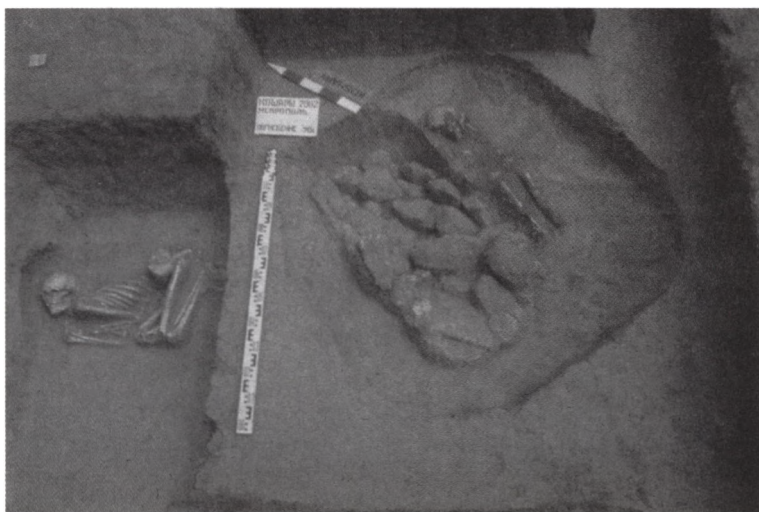
5. Koszary, nekropola, grób 178 w obrządku szkieletowym z pochówkiem skrępowanej kobiety, prawdopodobnie piastunki.

Nekropola, położona, jak wspomniano, w pewnej odległości od osady, czasowo odpowiada osadzie. Większość grobów była niestety obrabowana już w starożytności. Inwentarz grobowy nieobrabowanych grobów wskazuje wyraźnie na grecki charakter nekropoli. Jednak obecność kurhanu przebadanego w 1998 roku, którego scytyjski charakter nie ulega żadnej wątpliwości 13 , istnienie wielu pochówków o orientacji zachodniej (typowej jak się przyjmuje dla środowiska scytyjskiego) oraz niektóre charakterystyczne elementy w inwentarzu grobowym, pozwalają na stwierdzenie istnienia scytyjskiego komponentu wśród greckiej społeczności.