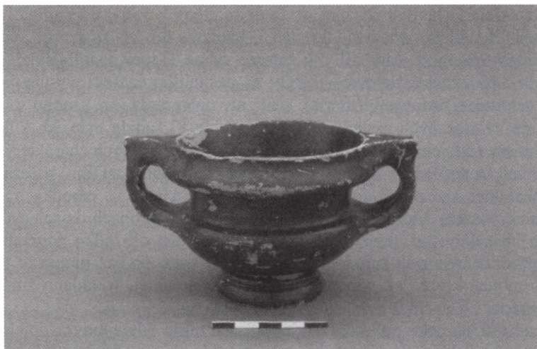
7. Koszary, nekropola, czarnopokostowany kantaros ateński z grobu 182, 3 ćw. IV wieku p.n.e.

ofiarnymi. W kampanii 2001 roku odkryto w „warstwie kulturowej” cmentarzyska wbite pionowo szyje amfor, które również służyły jako botrosy do spełniania libacji, czyli ofiar płynnych. Do podobnych celów również przeznaczone były, wspomniane wyżej, kamienne ołtarze.