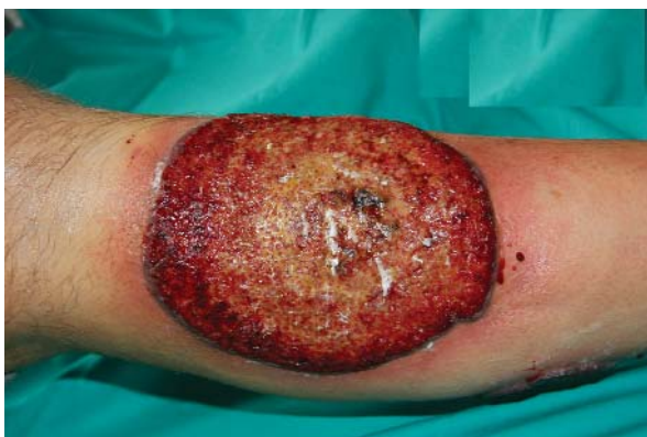
Ryc. 1. Rozległe owrzodzenie z bujającą ziarniną i charakterystycznym uniesionym brzegiem obejmujące dolną 1/3 przednią powierzchnię podudzia prawego

niego pacjenta z powodu rozległego owrzodzenia z bujającą, łatwo krwawiącą ziarniną, zlokalizowanego na przedniej powierzchni podudzia prawego. Pierwsze zmiany skórne pojawiły się 14 mies. wcześniej. Pacjent był wówczas leczony w rejonie dużymi dawkami kortykosteroidów (prednizon 80 mg/dobę), z okresowym ustąpieniem zmian. Po 2-miesięcznej remisji, mimo zastosowanej steroidoterapii, nastąpił nawrót zmian skórnych oraz stopniowe pogarszanie się stanu miejscowego.