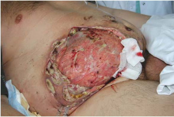
Ryc. 3. Na skórze brzucha w miejscu cięcia operacyjnego niegojące się owrzodzenie z postępującą martwicą. W górnym biegunie widoczne pętle jelit

lizacji w szpitalu rejonowym i dostarczonego na płycie CD przez rodzinę chorego (badanie oceniono w rejonie jako bez odchyień od normy), rozpoznano ropień przestrzeni zaotrzewnowej. Chorego w trybie pilnym przeniesiono do Kliniki Chirurgii Gastroenterologii UJCM, gdzie usunięto wyrostek robaczkowy i ropień przestrzeni zaotrzewnowej. W posiewie bakteriologicznym z jamy ropnia wykazano obecność Pseudomonas aeruginosa . W 6. dobie pooperacyjnej rozpoznano pęknięcie śledziony i wykonano splenektomię. W badaniu histopatologicznym śledziony opisano wiele ognisk martwicy otoczonych naciekami neutrofilowymi z rozszanymi ogniskami ziarniny olbrzymiokomórkowej. W tkance tłuszczowej wnęki śledziony stwierdzono dwa małe węzły chłonne z ogniskami ziarniny nabłonkatokomórkowej i obecność komórek wielojądrowych – histopatolog sugerował rozpoznanie PZ lub ropnia śledziony. Na skórze brzucha w miejscu cięcia operacyjnego powstało niegojące się owrzodzenie, które stopniowo ulegało postępującej martwicy, powodując ewentrację. Ostatecznie pozostawiono otwartą ranę do gojenia przez ziarninowanie (ryc. 3.). Stan pacjenta, mimo intensywnej terapii wyrównującej bilans elektrolitów, antybiotykoterapii, żywienia pozajelitowego, pogarszał się, postępowała także niewydolność wielonarządowa. Pacjent zmarł, mimo zastosowanego leczenia.