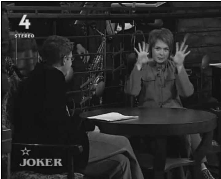
Ilustr. 20. „Otworzyły szeroko oczy”