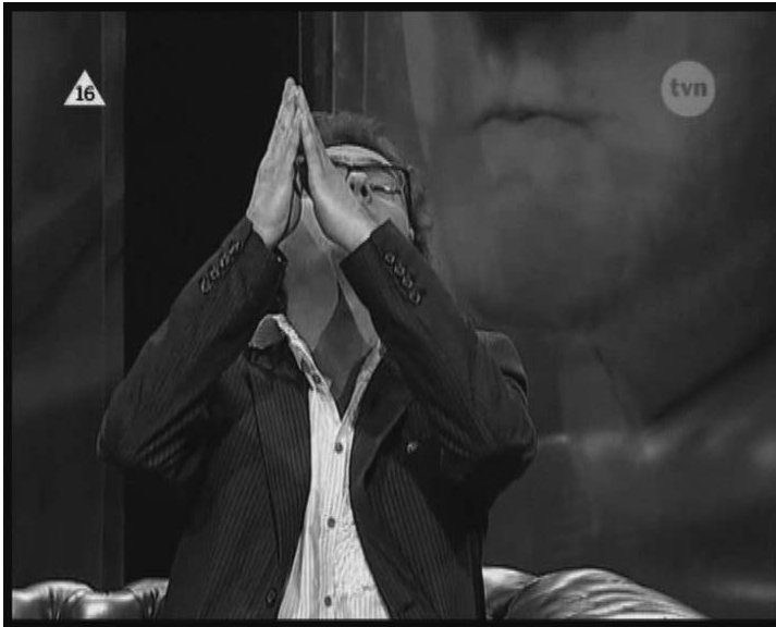
Ilustr. 15. „Pan mi załatwi to z szefem”

Z modyfikacją znaczenia aktu mowy przez emblematyczny gest mamy do czynienia i w innym przykładzie. Żartobliwa rozmowa dotyczy immunitetu poselskiego. Prowadzący mówi: