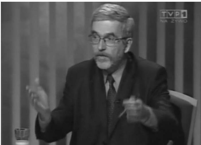
Ilustr. 26. „...i zdziwili się...”

W drugim przykładzie widzimy, jak ten gest staje się ikoną emocji już nieprzeżywanej, ale imitowanej, wskazującej na zdolność narratora do przyjmowania perspektywy innej niż własna, perspektywy empatycznej, naśladującej przeżywanie danej emocji przez innych. Narrator mówi krótko: i zdziwili się , przyjmując czyjąś perspektywę widzenia – właśnie okazanie zdumienia, zaskoczenia jakąś sytuacją i związanej z tym zaskoczeniem bezradności wyrażającej się gestycznie w bezradnym rozkładaniu rąk. Narrator sam nie przeżywa tej emocji, natomiast ją imituje.