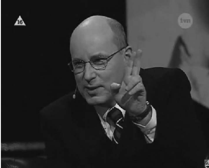
Ilustr. 16. „Ja nigdy nie korzystam z immunitetu”

3. Chcemy też zwrócić uwagę na to, że tak zwane ilustratory , które mogą stać się kulturowymi emblematami, takie jak złożone jak do modlitwy ręce mogące wyrażać akt błagania, bardzo często stanowią imitacje jakichś stanów emocjonalnych czy afektów, które oczywiście niewerbalnie, wyrażane są w sposób bardzo skrótowy i obrazowo ulegają metonimicznemu skróceniu.