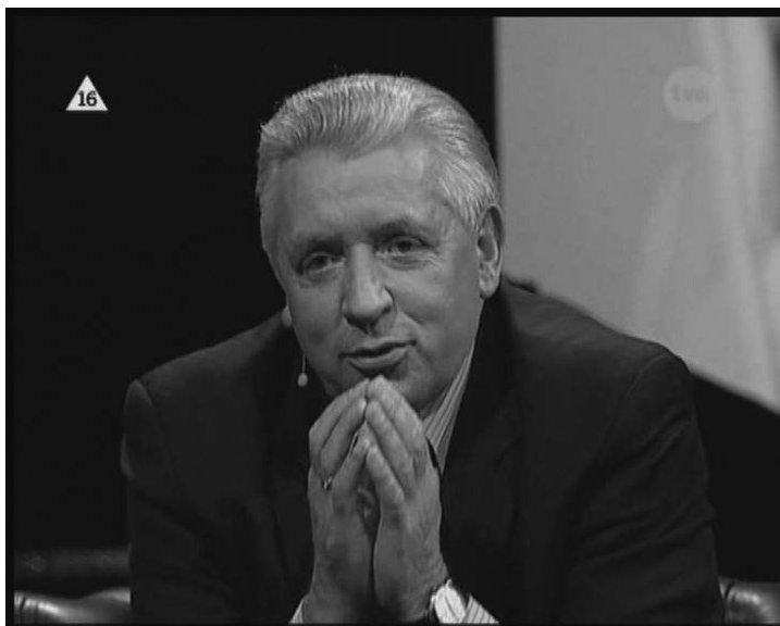
Ilustr. 19. „...taki spokojniutki jestem...”