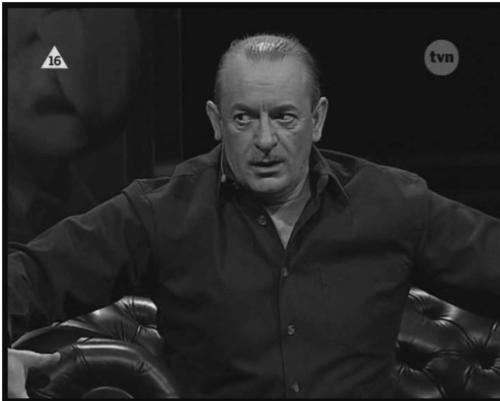
Ilustr. 11. „Ten taki?”