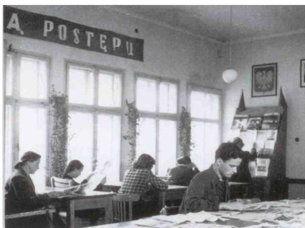
Ilustracja 3. Czytelnia Miejskiej Biblioteki Publicznej w latach 50. XX wieku