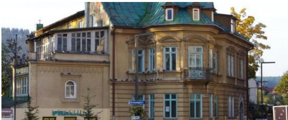
Ilustracja 2. Willa „Kresy” w Zakopanem (fot. Jacek Jopowicz)

Źródło: Stefan Żeromski w Zakopanem , [online] http://zeromszczacy.pl/stefan-zeromski-w-zakopanem-id235.html [dostęp: 5.11.2015].