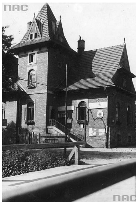
Ilustracja 1. Budynek Dworca Tatrzańskiego przy ulicy Krupówki 12 (data: 1910–1939)