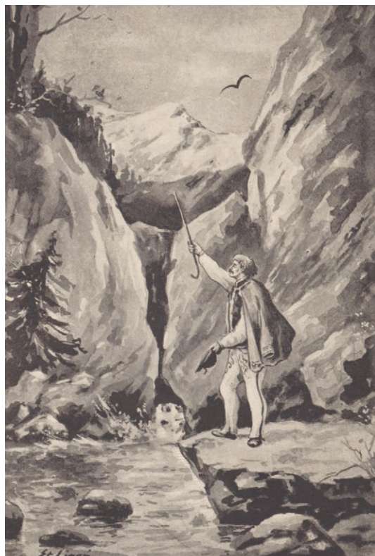
Ilustracja S. Ligońia do wiersza Laseczka Jezusowa

Illustration by S. Ligoń for the poem Laseczka Jezusowa of R. E. Andrusikiewicz 1911