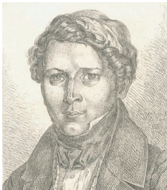
Seweryn Goszczyński, 1836 r., rys. i akwaf. K. W. Kielisiński. Portrait of Seweryn Goszczyński, drawing and etching by K. W. Kielisiński 1836.

Lud twierdzi, że przed wieki całą tę przestrzeń zalewała woda, która się zwała Karpackie morze; ale że jakiś bardzo dawny król Polski kazał przeciąć Pieniny w tym miejscu, gdzie dzisiaj Dunajec przepływa, i w rzeczy samej łożem tak ciasnym pomiędzy