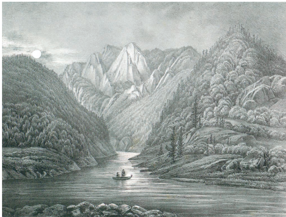
W Przełomie Pienińskim „Dunajec ujęty jest w skały jak w kanał olbrzymi” (S. Goszczyński 1853), rys. J. Szalay z Album szczawnickiego... (1858) [tytuł oryg. „Zatoka Dunajca pod Bersztykiem w Pieninach”]

The Dunajec River Gorge in the Pieniny Mts., illustration from Album szczawnickie... of J. Szalay 1858