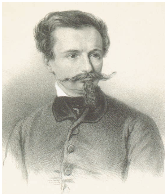
Wincenty Pol, 1855 r.