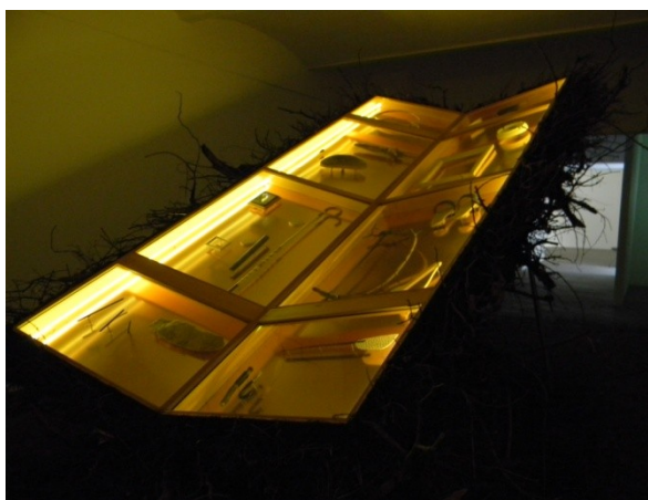
P. Halilaj, 26 Objekte n' Kumpir (2009)