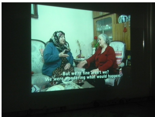
F. Özgür, Metamorphosis Chat (2010)