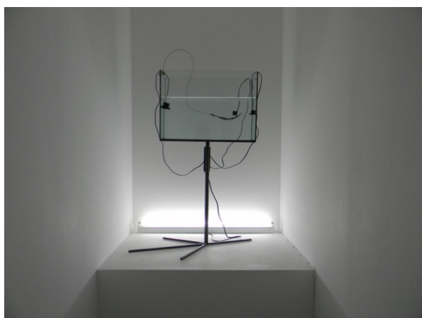
P. Halilaj, They are Lucky to be Bourgeois Hens (2008)