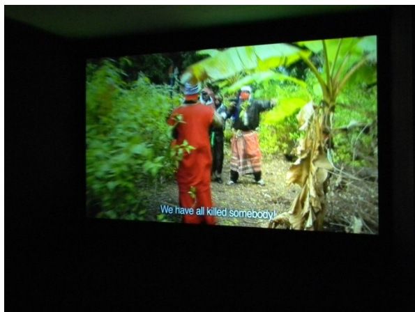
M. Boulos, All That is Solid Melts into Air (2008)