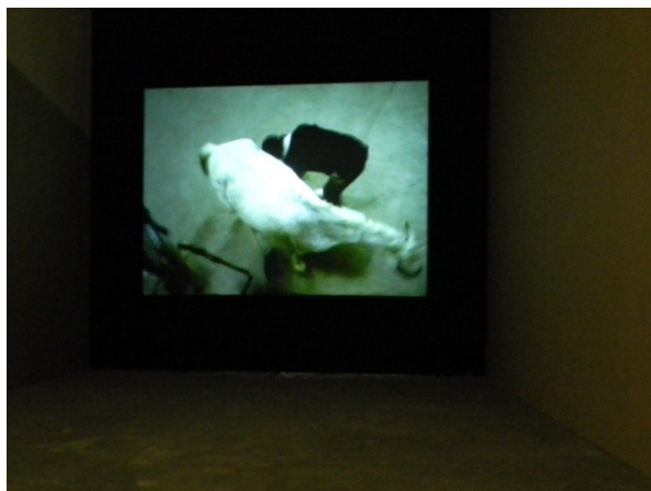
A. Lulaj, Problems with Relationship (2005)