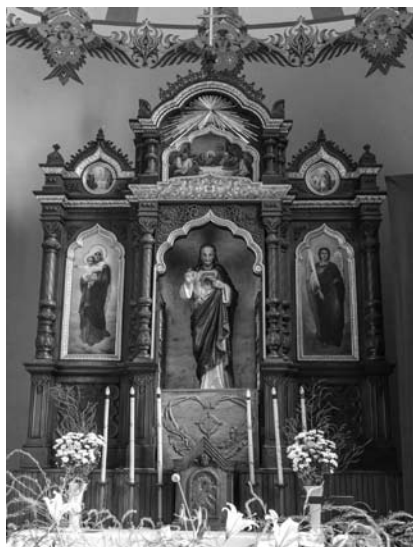
4. Fragment ikonostasu cerkwi pw. Pokrowy Matki Boskiej w Kozienicach, obecnie nastawa ołtarzowa w prezbiterium kościoła parafialnego w Brzeźnicy

Porównanie zachowanego w Muzeum Narodowym w Krakowie schematu ze wskazanymi nastawami ołtarzowymi nie pozostawia wątpliwości, że to struktura architektoniczna wykonana przez warsztat Krzywickiego i Morawskiego. Nie udało się jednak znaleźć informacji na temat twórcy ikon. Jak już wspomniałam, autorzy katalogu Cerkwie w centralnej Polsce 1815-1915 wymieniają nazwisko malarza warszawskiego Michałowskiego, nie powołując się jednak na żadne dokumenty, ani nie przybliżając tej