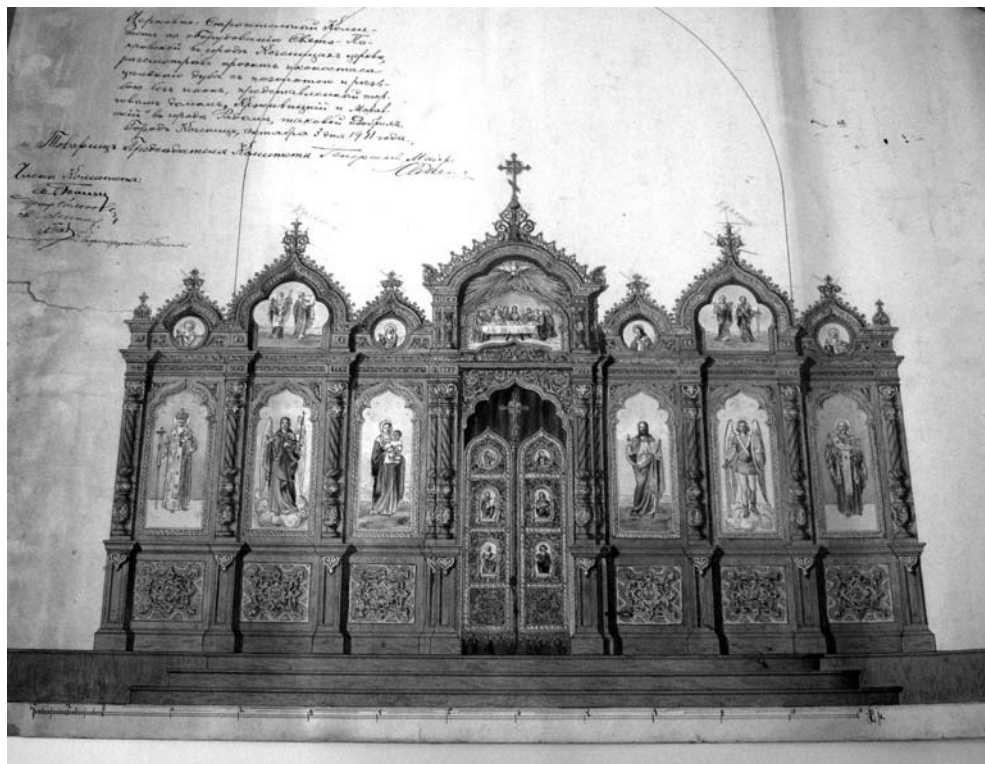
1. Schemat ikonostasu dla cerkwi pw. Pokrowy Matki Boskiej w Kozienicach, Muzeum Narodowe w Krakowie

ich ponad 200 4 . Jako że coraz liczniejsze oddziały wojskowe były przenoszone do odległych prowincji Cesarstwa Rosyjskiego, a dotychczasowe cerkwie tzw. domowe przestały być dla nich wystarczające, w 1900 roku minister wojny Aleksy N. Kuropatkin polecił przygotować projekt świątyni przeznaczonej specjalnie dla wojska 5 . Zaakceptowano projekt inżyniera Fiodora M. Wierzbickiego 6 . Miała być to świątynia murowana, jednokopułowa z dzwonnica, koszt budowy miał nie przekraczać 40 tys. rubli. Do wybuchu pierwszej wojny światowej w całym Imperium wybudowano około 50 niemal bliźniaczych cerkwi wojskowych, w tym 10 w Królestwie Polskim: w Augustowie, Kozienicach, Końskich, Lublinie, Puławach, Mińsku Mazowieckim, Ostrołęce, Przasnyszu, Staszowie i Warszawie 7 .