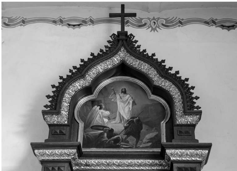
9. Zmartwychwstanie z dawnego ikonostasu cerkwi pw. Pokrowy Matki Boskiej w Kozienicach