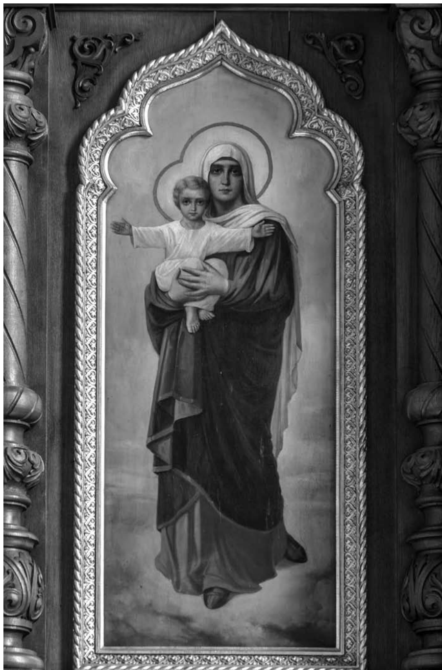
6. Matka Boska „Благодатное Небо” z dawnego ikonostasu cerkwi pw. Pokrowy Matki Boskiej w Kozienicach