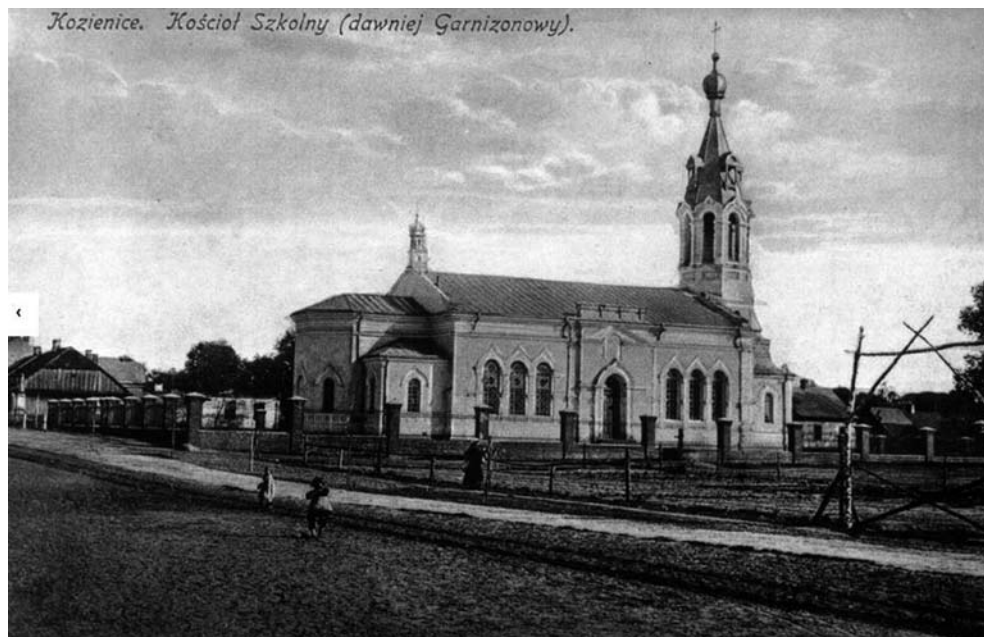
2. Cerkiew pw. Pokrowy Matki Boskiej w Kozienicach, pocztówka z lat 20. XX w.