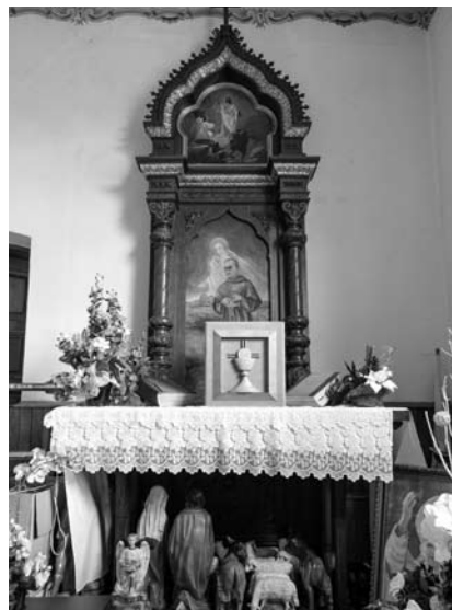
5. Fragment ikonostasu cerkwi pw. Pokrowy Matki Boskiej w Kozienicach, obecnie nastawa ołtarza bocznego w kaplicy południowej kościoła parafialnego w Brzeźnicy