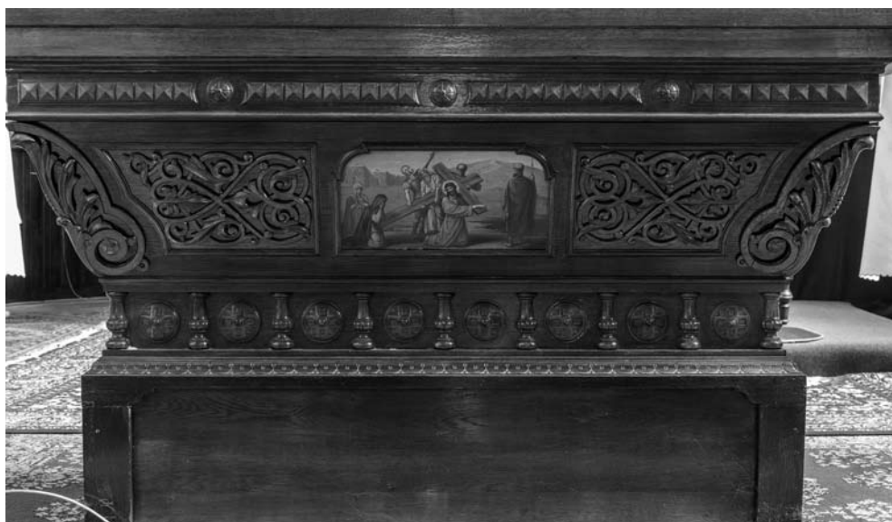
10. Ołtarz główny z cerkwi pw. Pokrowy Matki Boskiej w Kozienicach, obecnie w prezbiterium kościoła parafialnego w Brzeźnicy