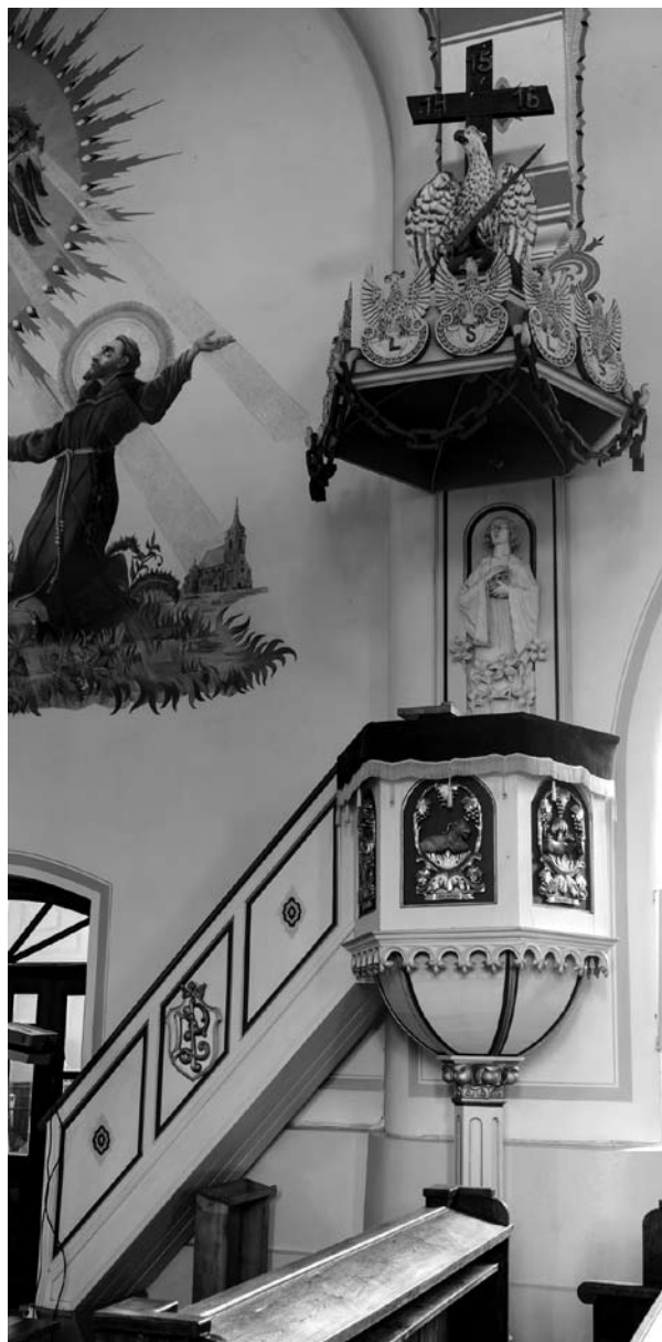
3. Ambona z dawnej cerkwi pw. Pokrowy Matki Boskiej w Kozienicach, obecnie w kościele parafialnym w Brzeźnicy