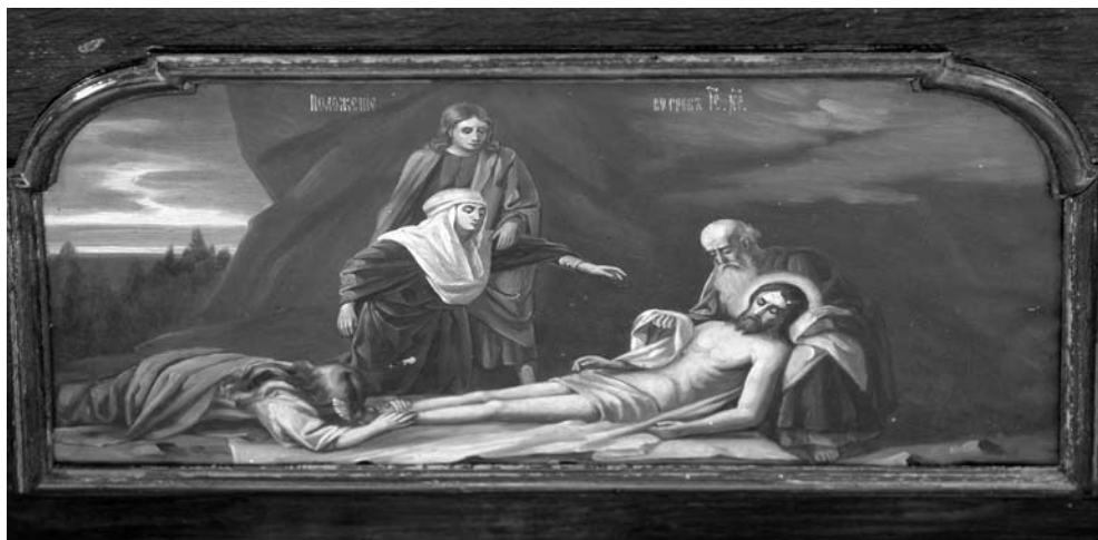
12. Oplakiwanie na ołtarzu z cerkwi pw. Pokrowy Matki Boskiej w Kozienicach

niewoli. Opuszczona, nikomu niepotrzebna wojskowa prawosławna cerkiew po niespełna dwudziestu latach przestała istnieć. Jedynym śladem jej obecności do tej pory były nieliczne wzmianki źródłowe i stare fotografie. Przypadkowe odkrycie w magazynach Muzeum Narodowego w Krakowie projektu ikonostasu dla Kozienickiej cerkwi pozwoliło na odszukanie fragmentów jej wystroju. Przetrwały przemarsz żołnierzy austriackich i polskich legionistów, katolickich użytkowników i robotników burzących cerkiew, Polskę sanacyjną, okupację niemiecką i czasy socjalizmu. Wykonane w zniewolonym Królestwie Polskim dla prawosławnych żołnierzy, dziś służą w niepodległej Rzeczypospolitej zwykłym katolickim parafianom. Przegroda ołtarzowa – symboliczna granica między tym, co ziemskie i niebiańskie, oraz ołtarz – obraz grobu Chrystusa