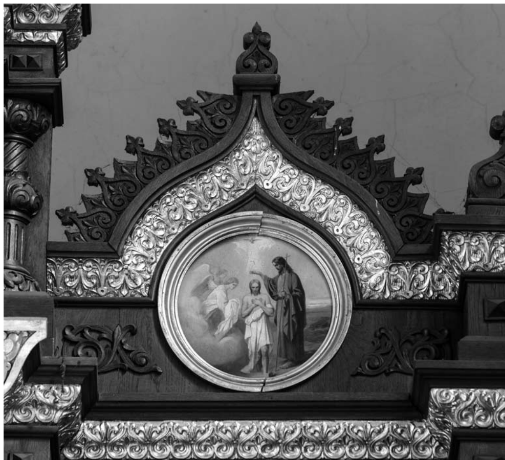
8. Chrzest Chrystusa z dawnego ikonostasu cerkwi pw. Pokrowy Matki Boskiej w Kozienicach

W kościele w Brzeźnicy znajduje się również dębowa mensa ołtarzowa (il. 10). Materiał, z którego została wykonana, charakter ornamentyki oraz cyryliczne napisy na przedstawieniach figuralnych pozwalają przypuszczać, że wyszła ona również z warsztatu Krzywickiego i Morawskiego oraz pierwotnie znajdowała się w cerkwi w Kozienicach. Tam też zapewne pełniła funkcję ołtarza głównego, świadczy o tym wytworna i bogata dekoracja rzeźbiarska oraz sceny Niesienia krzyża (il. 11) i Oplakiwania (il. 12), które odwołują się do symbolicznego znaczenia ołtarza jako grobu Chrystusa 43 .