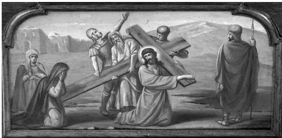
11. Niesienie krzyża na ołtarzu z cerkwi pw. Pokrowy Matki Boskiej w Kozienicach

niewoli. Opuszczona, nikomu niepotrzebna wojskowa prawosławna cerkiew po niespełna dwudziestu latach przestała istnieć. Jedynym śladem jej obecności do tej pory były nieliczne wzmianki źródłowe i stare fotografie. Przypadkowe odkrycie w magazynach Muzeum Narodowego w Krakowie projektu ikonostasu dla Kozienickiej cerkwi pozwoliło na odszukanie fragmentów jej wystroju. Przetrwały przemarsz żołnierzy austriackich i polskich legionistów, katolickich użytkowników i robotników burzących cerkiew, Polskę sanacyjną, okupację niemiecką i czasy socjalizmu. Wykonane w zniewolonym Królestwie Polskim dla prawosławnych żołnierzy, dziś służą w niepodległej Rzeczypospolitej zwykłym katolickim parafianom. Przegroda ołtarzowa – symboliczna granica między tym, co ziemskie i niebiańskie, oraz ołtarz – obraz grobu Chrystusa